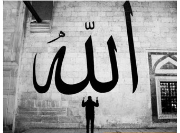
التقييم هو تقييم الله لا تقييم البشر

الوضع الطبيعي أن المُهندي هو فوق، ولو وجدت أهل الضلال بالدنيا قد علَّوا وأصبح لهم شأن، واستقبلهم الإعلام، وُسِطت لهم البُسط الحمراء، لا تلتفت، هذه دنيا، لكن عند الله من الذين فوق؟ أهل الهدى. فأنت فوق بتقييم الله لا بتقييم البشر، وتقييم المُنصفين من البشر.