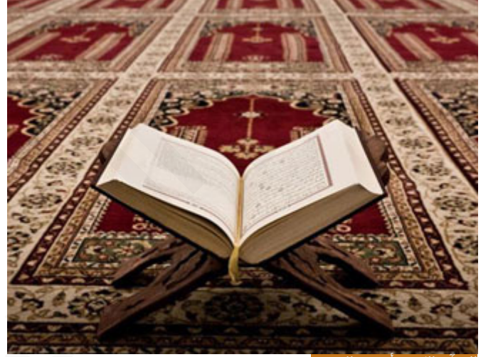
القرآن الكريم أحسن الحديث

يوجد (نزول) ويوجد (تترُّل)، فهنا (اللَّهُ تَرَلَّ أَحْسَنَ الْحَدِيثِ)، الحديث غالباً يطلق على الأخبار في اللغة، أي الأمر والنهي لا يقال له حديث. إذا قلت لك: ادرس، هذا ليس حديثاً، لكن لو قلت لك: سأروي لك قصة من القصص، هذا حديث.