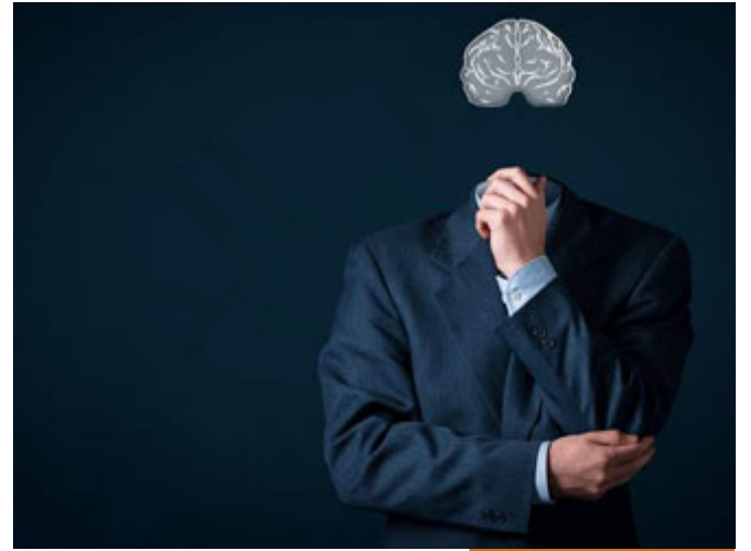
ركب الإنسان من عقل وشهوة