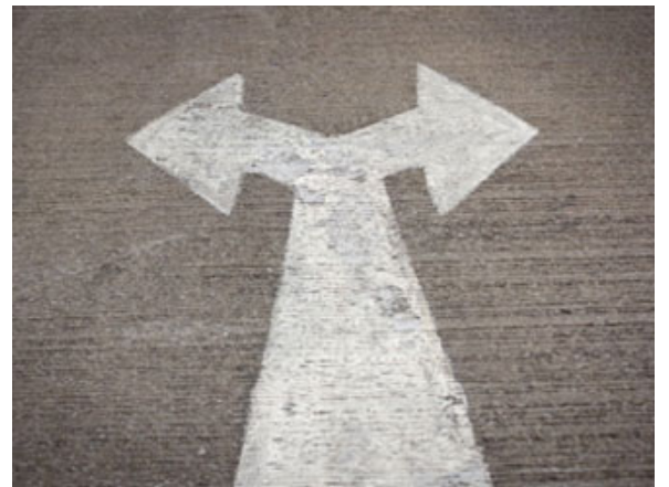
الوفاء ضد العذر

نعرّف الوفاء لغةً واصطلاحاً كما هو منهجنا في هذه الأبحاث.