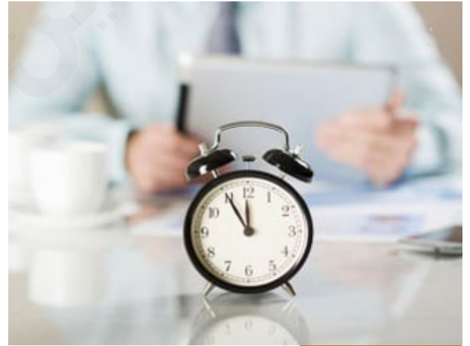
العصر يمضي والإنسان يخسر

بِسْمِ اللَّهِ الرَّحْمَنِ الرَّحِيمِ وَإِلَّا لَعَصِرَ (1) إِنَّ الْإِنْسَانَ لَفِي خُسْرٍ (2) (سورة العصر)