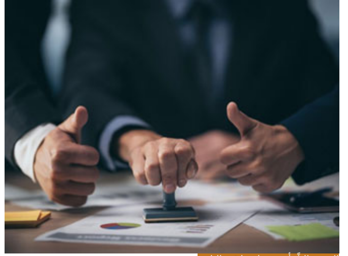
العقد غالباً يأتي فيما يتعاقده الناس

هذا الوفاء بالعهد إذا العقد؟ البعض قالوا: العهد والعقد شيئا واحداً، أي البعض ذكروا أنّ العهد والعقد شيء واحد، لكن يطلق عليه العهد أو العقد، أنا لا أومن كثيراً بالترادف في القرآن الكريم، بمعنى أنهما مترادفان مئة بالمئة، لا بُدَّ أن يكون أحدهما فيه مزيد شيء، فالعقد غالباً يأتي فيما يتعاقده الناس فيما بينهم مع استيناف، أي العقد عقد بيع بيني وبينك، عقد إيجار نوقعه، فالعقود فيها طرفان كلُّ منهما يستوثق من الآخر، أنا أسلمك الثمن وأنت تسلمني المبيع، العهد غالباً ما يأتي للأشياء المعنوية أكثر، أي عاهدنا الله على طاعته، وعاهدت أبي على ألا أشرب التبغ بعد اليوم، هذا عهد معنوي، أما عاقدت البائع على البيع أصبح الموضوع مادياً، عقد ثمن ومبيع، فيأتي غالباً العقد، فالعقد له نوع آخر بالوفاء، وجاء في آية قرآنيّة واحدة وهي الآية الأولى من المائدة قال تعالى: