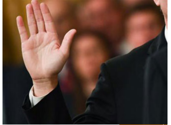
الأيمان هي حلف القسم

انظروا إلى العقوبة العظيمة؛ عقوبة من يُصعِّع عهد الله أولاً لا خلاق لهم في الآخرة، أي لا نصيب لهم في الآخرة، ولا يُكلمهم الله، ولا ينظر إليهم يوم القيامة، ولا يُركبهم، ولهم عذاب أليم، خمس عقوبات لنقض العهد، خمس عقوبات، ماذا يعني: