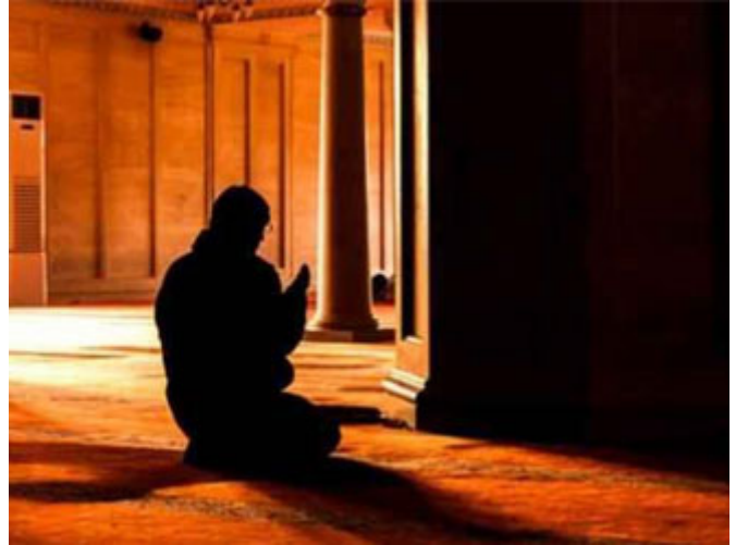
لا تفلق لأنك وحدك

هذه الصفة الثالثة للغرباء في أجاديت المصطفى صلى الله عليه وسلم (النزاع من القبائل) من كل قبيلة رجل، أو رجلان، أو مجموعة رجال، أي قلة قليلة من كل قبيلة، هم من يكونون غرباء آخر الزمان، اليوم ربما تجد حياً بأكمله، اليوم الحي نيابة عن القبيلة، لا تجد فيه على صلاة الفجر مثلاً مستيقظاً إلا رجلاً أو رجلين - نسأل الله السلامة - وتجد مثلاً مجموعة من التجار في غرفة من الغرف أي مئة تاجر فلا تجد فيهم إلا تاجراً أو تاجرين لا يأكلون الربا، أو لا يرضون أن يتعاملوا بالربا، والباقي يقول لك: هذا زمن لا يمكن أن تترك فيه الربا، أو ينتجج بحجج واهية، أو بالأصل ليس عنده مشكلة في هذا الأمر، ولا يقيم له وزناً، فمن كل قبيلة تجد من ينزع منها إلى الحق وإلى الخير فهنا أعود وأكرر: لا تفلق لأنك وحدك، يقول تعالى: