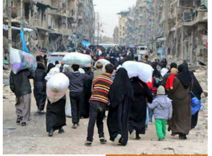
ترك الأوطان جعله الله قريباً لقتل النفس

والتالفة: غربة الوطن، وهذه غربة الوطن ربما يشترك معنا كثير من المتابعين، لاسيما أننا أهل سوريا الكرام، أهل الشام، أهل حمص، أهل حلب، أهل كل ذرة في تراب وطننا الغالي، محافظة محافظة من غير تحديد ولا تمييز اغتربنا عن أوطاننا، شاء الله لنا ذلك، وهذه حكمته نؤمن بها، ونسلم لها، ونرضى بما قدره لنا، ونحتسب أجر هذه الغربة عند الله تعالى، فترك الأوطان جعله الله تعالى قريباً لقتل النفس، قال تعالى: