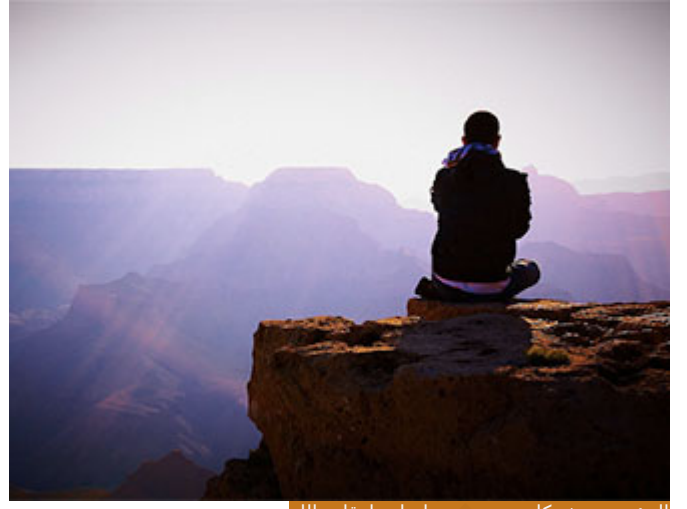
المؤمن يعيش كل يوم وهو ينظر لمخلوقات الله

إضافة إلى كل هذه المعاني سأضرب مثلاً: أنا من دمشق، عندما أتجول في مدينتي دمشق لا ألقى بالآ لما حولي، أركب في سيارتي أو في وسائط النقل العامة وأمضي في طريقي، لا تعينني لافتات المحلات، ولا الأبراج التي وجدت، ولا المحلات التجارية لأنني قد أفتها، دمشق ألفتني فما أنتبه إلى شيء وأنا في شوارعها، لكنني لو سافرت إلى مدينة أخرى مثلاً إلى حمص، حمص الجميلة اللطيفة، وأنا لم أزرها مثلاً في حياتي هذه أول مرة، فأنا الآن غريب في حمص، فأمشي في الشوارع وألتفت يمناً وبسرة، يعينني كل شيء في حمص، لأنني ساقم فيها أياماً وأعود، فأنتبه إلى معالمها، وأنتبه إلى طبيعتها، وأنتبه إلى مساجدها الجميلة، وإلى أسواقها الرائعة، يلفت نظري فيها كل شيء لأنني غريب من معاني (كُنْ فِي الدُّنْيَا كَأَنَّكَ غَرِيبٌ) أن المؤمن يعيش كل يوم وهو ينظر إلى مخلوقات الله وكأنه ينظر إليها للمرة الأولى، قال تعالى يعاتب هؤلاء الذين شردوا عن منهجه: