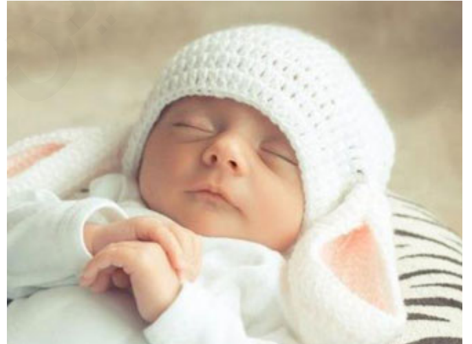
الإسلام يرفع المولود منذ كونه فكرةً

أخواننا الكرام! عودٌ على بدء، نحن في مناسبة ولادة، أي مولود جديد، هذا المولود الإسلام يرفعاه منذ أن يكون فكرةً، عندما يأمر الإسلام الأب أن يحسن اختيار الأم، والزوجة أن تحسن اختيار الزوج، هذا في الأصل رعاية لمن؟ للمولود القادم، ثم يأمر عندما يأتي بحسن اختيار اسمه، ثم يأمر في اليوم السابع بسنن معينة، ثم يأمر بتربيته على الأخلاق الفاضلة، وعلى الدين القويم، الإسلام يرفع الطفل منذ أن يكون فكرةً، وحتى يشب ويصبح شابًا.