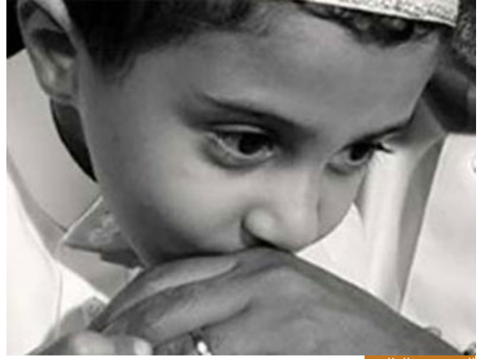
التوجه ببر الوالدين

(وَوَصَّيْنَا الْإِنْسَانَ بِوَالِدَيْهِ حَمَلَتْهُ أُمُّهُ وَهَنًا عَلَىٰ وَهْنٍ) ضعف (وَفَصَالَهُ فِي غَمٍّ) فطامه (أَنْ اشْكُرْ لِي وَلِوَالِدَيْكَ) بوجهه إلى بر الوالدين (إِلَى الْمَصِيرِ* وَإِنْ جَاهَدَاكَ عَلَىٰ أَنْ تُشْرِكَ بِي مَا لَيْسَ لَكَ بِهِ عِلْمٌ فَلَا تُطِعْهُمَا) رجعنا للتوحيد، من أعظم شخصين في الحياة لهما حق عليك بعد الله؟ والداك، وإذا أمراك بما يخالف شرع الله (فَلَا تُطِعْهُمَا وَصَاحِبُهُمَا فِي الدُّنْيَا مَعْرُوفًا وَاتَّبِعْ سَبِيلَ مَنْ أَنَابَ إِلَيَّ) أعاده إلى المربع الأول مربع التوحيد، وإن كانا والديك، لكن لا ينبغي أن تكون طاعة الوالدين مقدمة على أمر الله فما بالك بغيرهما؟!