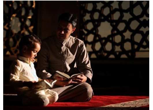
يجب أن تعود أطفالنا على المسجد

أخواننا الكرام! عودٌ على بدء، نحن في مناسبة ولادة، أي مولود جديد، هذا المولود الإسلام يرفعاه منذ أن يكون فكرةً، عندما يأمر الإسلام الأب أن يحسن اختيار الأم، والزوجة أن تحسن اختيار الزوج، هذا في الأصل رعاية لمن؟ للمولود القادم، ثم يأمر عندما يأتي بحسن اختيار اسمه، ثم يأمر في اليوم السابع بسنن معينة، ثم يأمر بتربيته على الأخلاق الفاضلة، وعلى الدين القويم، الإسلام يرفع الطفل منذ أن يكون فكرةً، وحتى يشب ويصبح شابًا.