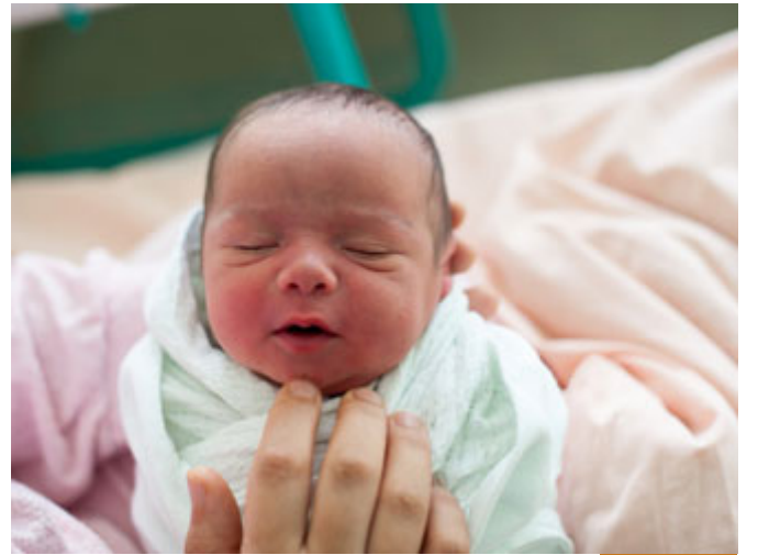
ما هي العقيقة؟

بسم الله الرحمن الرحيم، الحمد لله رب العالمين، والصلاة والسلام على سيد الأولين والآخرين، وعلى آله وأصحابه أجمعين، يا ربنا لك الحمد كما ينبغي لجلال وجهك، ولعظيم سلطانك، سبحانك لا تحصي ثناءً عليك أنت كما أثنيت على نفسك، يا رب ماذا فقد من وجدك؟ وماذا وجد من فقدك؟