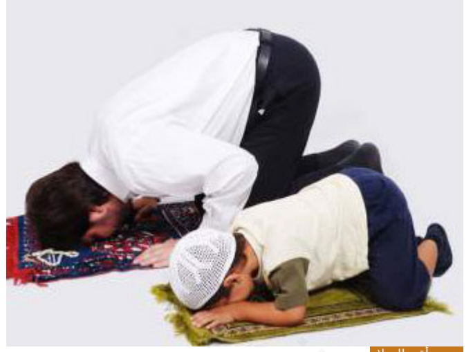
معنى أقم الصلاة

أخواننا الكرام؛ صلّ شيء وأقم الصلاة شيء آخر، التعريف الفقهي للصلاة: أفعالٌ وأقوالٌ مفتتحة بالتكبير مختتمة بالتسليم، انتهى، لكن أقم الصلاة، دعونا نعود إلى لغة العرب، العرب كانوا يقولوا: أقم القوم سوفهم، ما معنى أقم القوم سوفهم؟ هل معناها وضعوا البضاعة؟ لا، صنعوا خيمة كبيرة ووزعوا البضائع؟ لا، أقم القوم سوفهم أي لم يعطلوها من البيع والشراء إذا كان هناك سوق لا يوجد فيه بيع وشراء لم تقم السوق، فإذا لم تنه الصلاة عن الفحشاء والمنكر فإنها لم تقم: