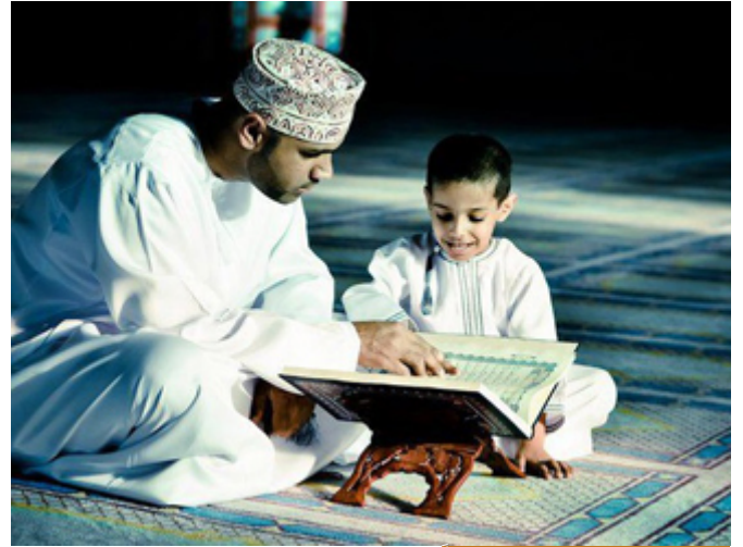
التربية بالمراقبة شيء عظيم جداً

هنا الجلّاس عندما تلا النبي صلى الله عليه وسلم الآيات وقف مصدوماً، عمير استبشّر، الوحي نزل من أجله، قال الجلّاس: بل أتوب يا رسول الله، بل أتوب، وأسأل الله أن يغفر لي، الآن يمسك النبي صلى الله عليه وسلم أذن عمير برفق ويقول له: وقت أذنك ما سمعت يا عمير، وصدّقك ربك، قال: أما الجلّاس فزاد من بره وعطائه لعمير وكان يقول: هذا الذي تجاني الله به من النار.