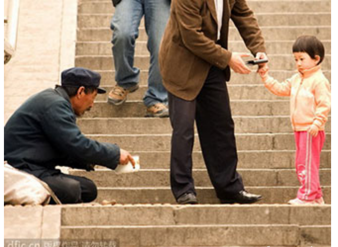
إذا رأيت معروفاً فمشجع عليه

(تأْتِي أَقِمِ الصَّلَاةَ وَأْمُرَ بِالْمَعْرُوفِ وَنَهَى عَنِ الْمُنْكَرِ) هذه الفريضة المعطلة، أقم الصلّاة، تصلحك الصلاة، ويصلح بها من حولك، لكن هناك فريضة اسمها الأمر بالمعروف والنهي عن المنكر، إذا رأيت معروفاً فمشجع عليه، إذا رأيت منكراً فانه عنه، على الأقل ضمن دائرة البيت، ضمن دائرة العمل، ثم وسع الدائرة ما استطعت.