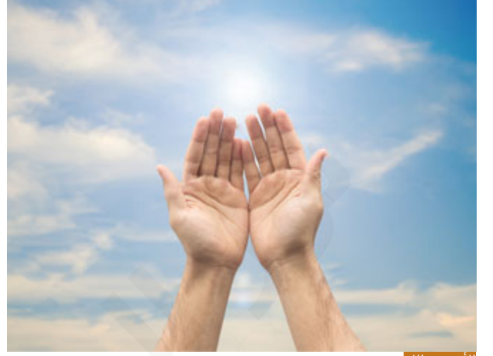
الأمر بيد الله

هذه الوصية الأولى، وصية التوحيد، إذا أردت أن تبدأ مع ابنك في البناء، فابدأ بالتوحيد، ستسألني: كيف؟ سأعطيك مثالاً رواه لي مرة صديق عزيز، قال لي: ابنتي في البيت قالت لي: بابا اشتر لي ثوباً من أجل العيد، قال لها الأب: أنا لا أملك مالا، أسألي الله عز وجل أن يرزقني مالا لأتيك بما تريد، الأمر بيده وحده، قال لي: استيقظت على الفجر فوجدت ابنتي الصغيرة تصلي وتدعو الله: يا رب ارزقني فستاناً جميلاً، الطلب من الله، قال لي: والله في الصباح رزقني الله، وهذا واقع، وهو لا يكذب عليها، الرزق بيده وحده، فقال: اشترت لها فستاناً برزق الله عز وجل، وعلمها درساً، ليس المثال للحصر، ولكن في كل شيء يمكن أن توجه ابنك إلى أنه لا يوجد إلا الله، الأب عندما يتابع الأخبار مساءً على إحدى الشاشات ويقول: الأمور بيد أمريكا، ولا أحد يستطيع أن يفعل شيئاً، وأمريكا الذي تريده يحصل، أين الله عز وجل؟! فهذا الطفل نشأ على أن أمريكا المتحكمة بالعالم وليس ربنا عز وجل، أمريكا لن تغفل من قبضة الله: