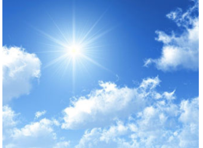
الله عز وجل براك حيث كنت

الآن دخل معه بالتفاصيل؛ الآية الأولى: (لَا تُشْرِكْ بِاللَّهِ) عموميات، أما الآن بالتفاصيل.