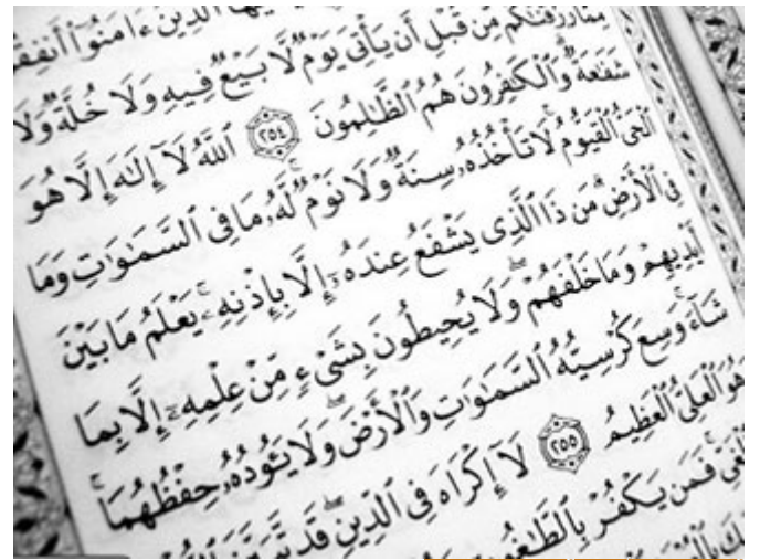
آية الكرسي أعظم آية في كتاب الله

أحبابنا الكرام؛ في اللقاء الماضي ذكرنا في بدايته قصة عبد الله بن مسعود رضي الله عنه، لما سأله عمر رضي الله عنه، سيدنا عمر يسير ليلاً، ومن بعيد هناك قوم يمرّون في الصحراء، فناداهم سيدنا عمر، نادي المناذي، قال: من أين القوم؟ قالوا: من الفج العميق، قال: أين تريدون؟ قالوا: البيت العتيق، فقال عمر رضي الله عنه: إن فيهم لعالمًا، الأجوبة توحى بوجود شخص عالم، قال: فناداهم: أي القرآن أعظم؟ فجاءه الجواب: