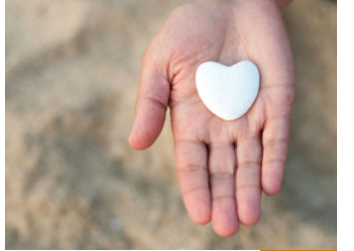
الصادق تحبه الناس

نحن كل تكاليفنا ضمن الوسع، لا يوجد أي تكليف خارجاً عن الفهم البشري، أي عندما يقول لنا الله تعالى: اصدق، الصدق لنا، الصادق الناس تحبه، وتجارته تروج، ويدخل الجنة يوم القيامة، عندما يقول لك: لا تكذب، هذا النهي لنا، أي الأوامر الإلهية والنواهي الإلهية ليس فيها شيء غير مفهوم اليوم لأمة المسلمين، وهذا من رحمة الله بهذه الأمة، كل الأوامر مفهومة، أعطني أمراً أمرنا الله عز وجل به وتقول: والله أنا أحسه ظلماً؟ لا يوجد ظلم، أمرني بغض بصري، لكن ربنا عز وجل أيضاً مليار مسلم أن يغضوا بصرهم عن زوجتك، لم يأمرك فقط أن تغض بصرك عن الزوجات، يوجد مليار أمر من أجل زوجتك كي يحميها المجتمع أيضاً من نظرات العائنين، فالقضية ليست قضية الأوامر الإلهية، ليست القضية خارج مفهوم البشر اليوم، كله واضح، الأنبياء ربنا عز وجل ابتلاهم أحياناً بأوامر صعبة، أي عندما قال: اذبح ابنك، والله لا أحد من البشر اليوم يطيق هذا الأمر، أو يحتمله.