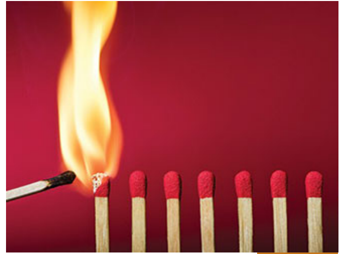
نجر، في عصر الفتن