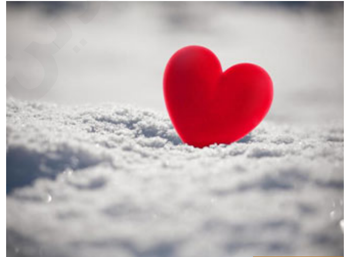
القلوب هي التي تعقل

البيض قالوا: القلب كما تقول قلب الجوزة داخلها، أي القلب هو شيء بداخل الإنسان يعقل به، اليوم هناك أبحاث كثيرة علمية اطلعت على بعضها وتنبير بعضها على قنوات مهمة في أنهم بدؤوا يكتشفون أن القلب الذي هو الغدة الصنوبرية يعقل، أي فيه المدركات، وفيه الحب والبغض والكره، وإضافة له كل العواطف يعقلها بقلبه، أي يحب الله بقلبه الذي هو هذه الغدة، وهذا فهموه بعد أن قاموا بزراعة القلب، عندما أصبح هناك عملية نقل قلب اكتشفوا أن هناك إنساناً تغيرت طباعه مع القلب الجديد، إذا القلب كان يعقل أشياء فلما نقل إلى إنسان آخر نقلت إليه المعقولات معه، فالقلوب هي التي تعقل، سابقاً كان العلماء يكتبون بهذا الموضوع: بعضهم يقول: العقل يتم بالدماغ، والبعض الآخر يقول: بالقلب، اليوم ربما والله أعلم هذا علمياً ماذا يثبت، ولكن القرآن الكريم أثبت أن العقل للقلب قال: (قُلُوبٌ يَعْمَلُونَ بِهَا) فالعقل يكون بالقلب أي الفهم والإدراك الحقيقي يكون بالقلب، والعقل بمعنى ربط الإنسان عن المعاصي والآثام (أن يمنع نفسه) أيضاً بالقلب، وهذه قضية طويلة لن نخوض فيها، ولكن أعود إلى القلب الآن، القلب أحبنا الكرام؛ هو المصغرة التي إن صلحت صلح الجسد كله، وإن فسدت فسد الجسد كله.