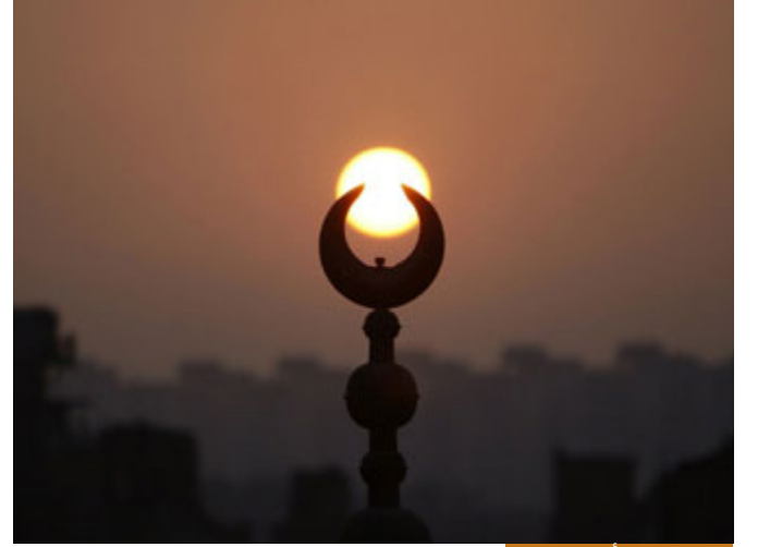
مصيبة الدين أعظم مصيبة

أن يصل الإنسان إلى مرحلة يظن بها بالله والعياذ بالله ظن السوء فهذا أعظم مصيبة له، هذا أعظم من مصيبته في الهزيمة، لذلك كان عمر رضي الله عنه إذا أصابته مصيبة قال: الحمد لله إذ لم تكن في ديني، لأن مصيبة الدين أعظم مصيبة، أن يسيء الظن بربه، إن يظن أن الله تعالى لا ينصر دينه، ولا يحق الحق، قد يؤخر الله عزَّ وجلَّ نصر أوليائه وأحبابه، ليتحقق لهم التمكين الذي يريده ولكي يعودوا إلى خالقهم ومولاهم، فهناك حكمة في تأخير النصر، لكن ليست أبداً أن الله عزَّ وجلَّ لا يريد أن ينصر أهل الحق، فحسن الظن بالله أيها الأحباب؛ أيضاً مما تعالج به الهزيمة النفسية.