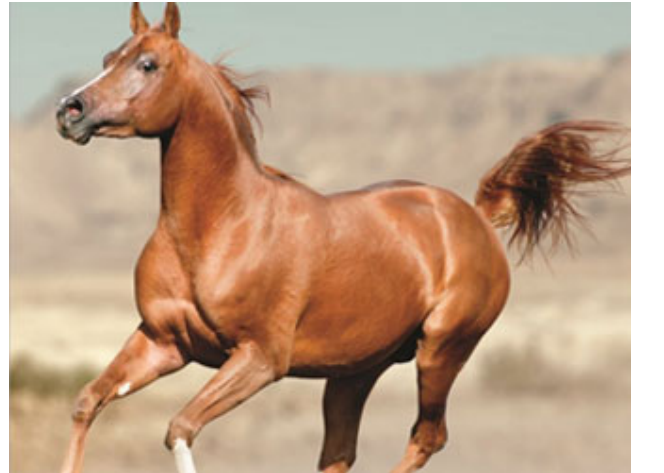
الخيل وفية لصاحبها

بِسْمِ اللَّهِ الرَّحْمَنِ الرَّحِيمِ إِنَّ الْإِنْسَانَ لِرَبِّهِ لَكَنُودٌ (6)