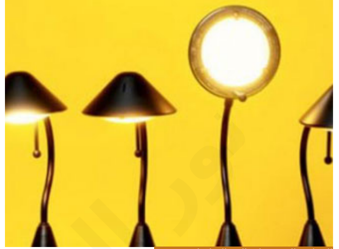
الاختلاف المبني على المصالح اختلاف مذموم

أخواننا الكرام؛ الاختلاف، أظن من الصور المذمومة جداً أن يطلق قول: الاختلاف رحمة، أي ربما من زاوية ضيقة في بعض المسائل الفقهية يكون اختلاف الفقهاء فيه رحمة، بوجود قولين مؤيدين بدليل فيتبع هذا وهذا، لكن عموم الكلام والبعض يظنها حديثاً، اختلاف أمّتي رحمة، إذا كان الاختلاف رحمة فالاتفاق ما هو؟! هذا ليس حديثاً طبعاً، لكن هناك اختلاف مبني على المصالح والأهواء وهذا اختلاف مذموم ومنبذ، قال تعالى: