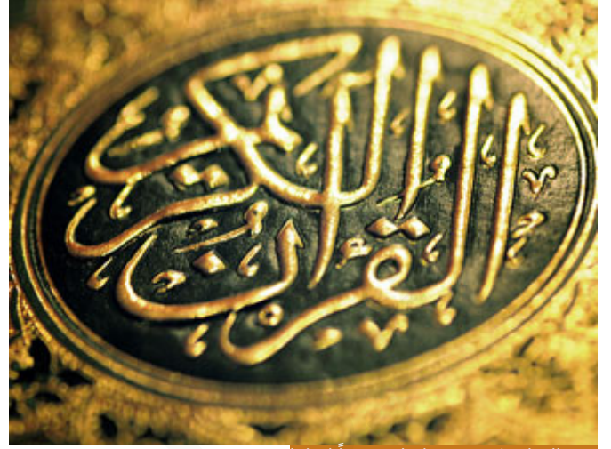
هجر القرآن يكون بعدم اتخاذه منهجاً لحياتنا

ليس في القرآن كله شكوى يشكوها رسول الله صلى الله عليه وسلم لربه إلا هذه الشكوى: (وَقَالَ الرَّسُولُ يَا رَبِّ إِنَّ قَوْمِي اتَّخَذُوا هَذَا الْقُرْآنَ مَهْجُورًا) وهجر القرآن لا يعني أننا لم نعلقه في بيوتنا كلوجات، ولا يعني أننا لم نعلق (إِنَّا قَتَلْنَا لَكَ قَتْلًا مَبِينًا) في صدر محلاتنا التجارية، ولكن يعني أننا لم نتخذه منهجاً في حياتنا، فأنت عندما تعظم القرآن تتخذه منهجاً، سأعطيك مثلاً: عندما أذهب إلى طبيب، ويعالجنني من مرض ما، ويصف لي وصفة، الآن كيف أعظم الطبيب؟ أذهب إلى الصيدلاني وأشتري الوصفة، لكن لو قلت: والله هذا الطبيب عظيم جداً، ما شاء الله، درس في كذا بلد غربي، وعنده كذا شهادة، ثم مرقت الوصفة، ولم أعمل بها، فهل أنا معظم لهذه الوصفة أو لهذا الطبيب؟ لا، لأنني لم أعمل بالوصفة التي وصفها، فأنا عندما أقول: إننا هجرنا القرآن الكريم، أو إن النبي صلى الله عليه وسلم يشكو هجران أمته القرآن، فلا نقصد أننا هجرنا التبرك به، وإنما هجرنا العمل به، هجرنا قراءته، تلاوته، تدبره، فهمه، العمل به، لأن الله تعالى عندما قال: