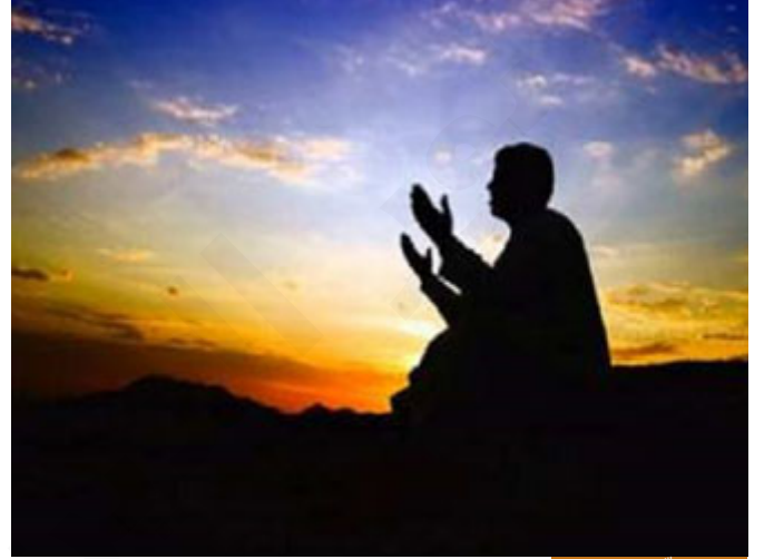
التوبة حل لكل معصية

ما الحل للمعصية؟ التوبة، كل إنسان يمكن أن يقع في معصية الله عز وجل، ولكن المصيبة في عدم المسارعة إلى التوبة، في عدم المسارعة إلى التوبة، ابن قدامة المقدسي له كتاب اسمه: "التوابون"، يذكر فيه قصص التائبين مما وصله أو سمعه من القدامى وممن في عصره، فذكر قصة في كتابه، أنه لحق فحط بقوم موسى فاجتمعوا إليه، لا يوجد أمطار، قالوا: يا موسى ادع لنا ربك أن يسقينا الغيث، فقام معهم وخرجوا إلى الصحراء ليستسقوا، الاستسقاء موجود حتى قبل شريعتنا، بشريعة موسى الاستسقاء موجود: