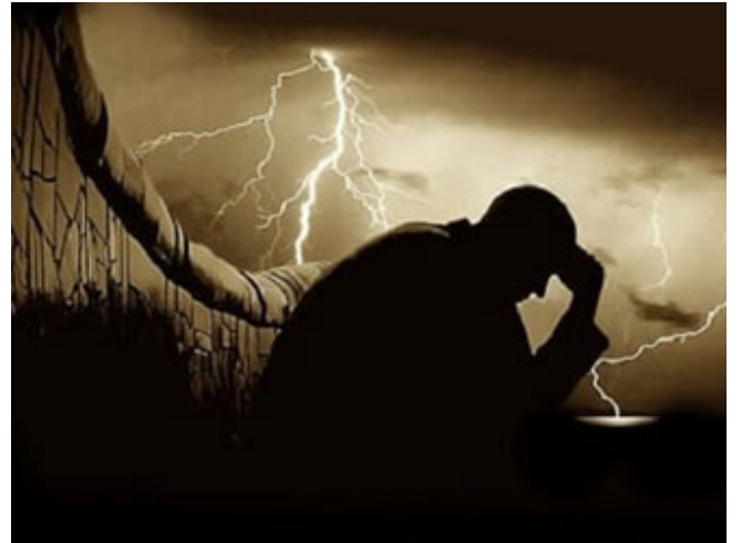
المعاصي-معصية غلبة، و معصية كبير

طلب السقيا من الله، فخرجوا إلى الصحراء ليستسقوا، وهم سبعون ألفاً أو يزيدون، أي عدد كبير، فقال موسى: إلهنا اسقنا غيثك، وانشر علينا رحمتك، وارحمنا بالأطفال الرضع، والبهائم الربع، والنبويخ الركع، قال: فما ازدادت السماء إلا تفتتاً، أي ازدادت حدة الشمس في السماء، وما ازدادت الشمس إلا حرارةً، فقال موسى: يا رب استسقناك ولم تسقنا، طلبنا السقيا ولم نسق، فقال الله له: إن فيكم عبداً يبارزني بالمعصية منذ أربعين عاماً، هناك معصية غلبة، و معصية كبر، معصية الغلبة التوبة منها سهلة، والتجاوز عنها من قبل الله سهل جداً، لكن معصية الكبر التوبة منها صعبة، والتجاوز عنها من قبل الله بعيد المنال، والدليل أن آدم عصى ربه، والشيطان والعياذ بالله عصى ربه، لكن شتان بين المعصيتين، إبليس عندما عصى ربه: