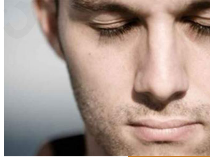
المسلم بغض النظر عن العورات

والعباد بالله، ليس من شأن المسلم أن يتتبع العورات، المسلم بغض النظر عن العورات، لا يتتبعها، فإذا رأى شيئاً منها عرضاً ستره وكأنه لم يره، هذا هو مجتمع المسلمين، ما دام أخوك المسلم لا يجاهر بمعصية، ولا يقوم بها جهاراً نهاراً في الطرقات، فإن في قلبه بقية من خير، فأياك أن تفضحه، إن رأيت منه سوءاً فاصح له، إن رأيت منه شراً فاستر عليه، لعل الله تعالى يستر عليك.