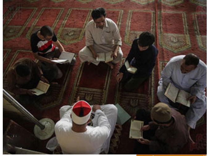
المفتي يقضي وفق ما يسمع

ولو كان من قضى أو من أفتى هو رسول الله صلى الله عليه وسلم فإنه أفتى وقضى وفق ما سمع، لكنك محاسبٌ إن كان هناك حقٌ للعباد فلا يأخذه وإنما أقطع له قطعة من النار، انظروا الآن إلى هذين الرجلين ما أعظم ما ربي النبي عليه الصلاة والسلام أصحابه عليه، فيكى الرجلان، وقال كل واحدٍ منهما لصاحبه حقي لك، ما عدت أريد شيئاً، لا أريد أن آخذ قطعة من النار، وكل واحد يقول: انتهى الخلاف، حقي لك، فجعل كلٌ منهما يقول: حقي لك، فقال لهما النبي صلى الله عليه وسلم: أما إن فعلتما كذلك فاقتما فتوخيا الحق ثم استهما -قرعة، آجرتاً قرعة - ثم تحالاً ليقول كلٌ منكما لصاحبه قد برئت ذمتك مني حتى يلقي الله وهو عنهما راض.