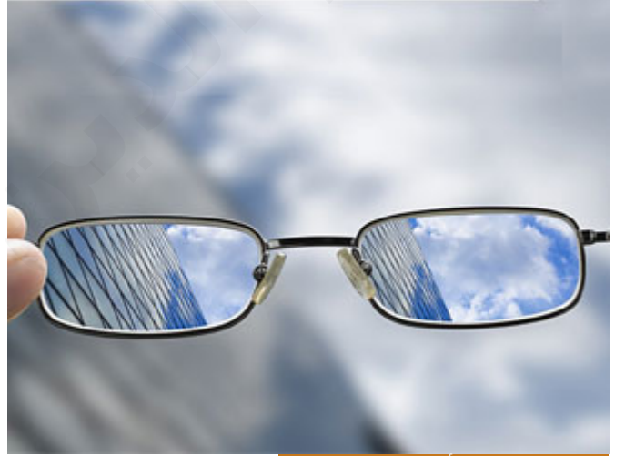
يجب على المستفتي أن يذكر الواقعة كما هي

أيها الأخوة الكرام؛ مما يجب على المستفتي أيضاً أن يذكر الواقعة كما هي، فلا يغير ولا يبدل ولا يعتمد على شيء حتى يأخذ الفتوى التي يريد.