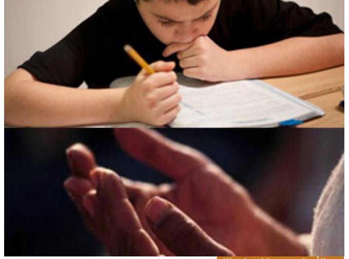
خذ بالأسباب ثم توكل على الله

إذا أيها الأخوة الكرام: اتخذ رسول الله الأسباب، ثم لما وصلوا إليه إلى الغار أظهر أعظم توكل على رب الأرباب، خذ بالأسباب وكأنها كل شيء، ثم توكل على الله وكأن الأسباب ليست بشيء، هذا هو الموقف الإسلامي، هذا هو الموقف النبوي الذي يُعلِّمنا إياه معلم الخير صلى الله عليه وسلم. هذا عمر رضي الله عنه وأرضاه يمر بقومٍ قد تركوا العمل، وجلسوا لا يعملون، فيقول لهم: من أنتم؟ قالوا: نحن المتوكلون على الله، فيقول عمر: كذبتُم، بل أنتم المُتَّكِلون، ألا أخبركم بالمتوكلين على الله؟ رجلٌ ألقى حبةً في بطن الأرض ثم توكل على ربه، فالتوكل على الله هو من يزرع ويغرس ثم يقول: يا رب، هو من يدرس قبل الامتحان ثم يقول: يا رب، هو من يتفقد مركبته قبل السفر ثم يقول: يا رب، هو من يبني أمته بناءً صحيحاً، ويربي أولاده، وبعد العدة، ثم يقول: يا رب النصر من عندك، هذا هو المتوكل على الله، أما المتكل أو المتواكل فهو شخص يجلس ويقول: قد توكلت على الله، وبترك الأخذ بالأسباب، فهذا يفترى فريئةً عظيمةً على التوكل، وعلى دين الله تعالى.