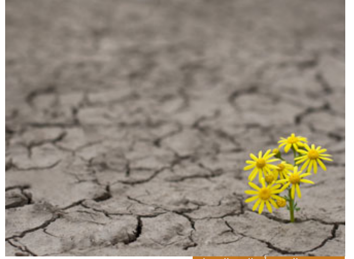
من دروس الهجرة أن الحق إلى ثبات

أيها الأخوة الكرام، أيها الأحباب: إن الهجرة النبوية الشريفة تذكركم بأن النصر آت، وبأن الحق أبليج، وبأن الباطل لجلج، وتذكرنا بأن الباطل مهما انتفش، ومهما بدت له صولة ودولة فإنه إلى زوال: