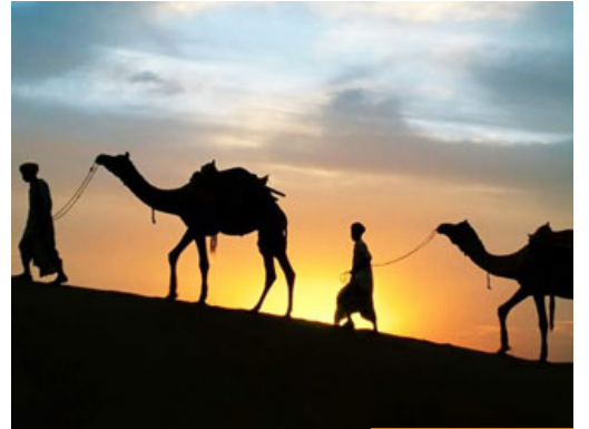
الهجرة حركة مدروسة وواعية

وبعد فيا أيها الأخوة الأحباب: نحن على مشارف عام هجري جديد نسأل الله أن يعيده علينا وعلى الأمة الإسلامية بالخير والثمن والبركات، فما الهجرة؟ الهجرة أيها الكرام يمكن أن نعرفها فنقول: هي حركة مدروسة وواعية لتغيير الواقع نحو الأفضل، فأنت حركة لا تكون واعية منصبة بضوابط الشرع فإن التغيير سوف يكون نحو الأسوأ حتماً، لكن الهجرة كانت حركة واعية، قام بها النبي صلى الله عليه وسلم وصحبه الكرام عن دراية، وعن تخطيط، وعن علم، فكانت بحق أعظم تغيير عرفه العالم نحو الأفضل، حيث انتقلت الأمة الإسلامية من مرحلة الدعوة إلى مرحلة الدولة، ومن مرحلة التشتت والفرقة إلى مرحلة التآلف والوحدة، ومن مرحلة الصبر إلى مرحلة النصر، هكذا كانت الهجرة، لأنها كانت حركة واعية ولا أدل على وعي هذه الحركة وكونها حركة مدروسة من أنه قد سبقها إرهابات من بيعة العقبة الأولى، وبيعة العقبة الثانية، وإرسال سيدنا مصعب بن عمير إلى المدينة ليكون مُقرئ المدينة، والسفير الأول في الإسلام، ليُعلِّم الناس دينهم، ويهتتم لقبول الواقع الجديد، إذا كانت حركة مدروسة واعية نحو تغيير الواقع فكانت حتماً إلى الأفضل، أما الحركات التي لا تكون واعية ولا مدروسة ودونكم كثير من الأمثلة في عالمنا الحديث فإن التغيير غالباً ما يكون نحو الأسوأ، فنحن نحتاج إلى بناء الأمة قبل أن نحتاج إلى بناء الدولة، نحتاج إلى بناء الفرد قبل أن نحتاج إلى بناء الحاكم، لابد من أن تكون حركاتنا مدروسة منصبة بضوابط الشرع.