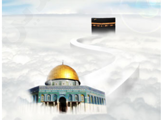
الإسراء والمعراج معجزة خارج القوانين