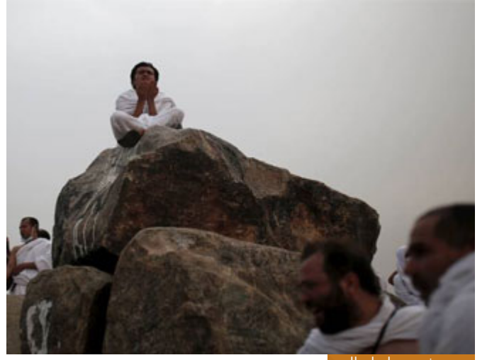
يوم عرفة يوم إتمام الدين

إذاً هو يوم إتمام الدين، وإكمال نعمة الله تعالى على أمة الإسلام، فما أجمل هذا اليوم الذي نتذكر فيه حفظ دين المصطفى صلى الله عليه وسلم لأمته من بعده إلى قيام الساعة، وما أحرانا في هذا اليوم أن نجدد العهد على أنه لا تجديد في الدين، إلا إن كان التجديد يعني أن نعيد للدين ألقه، وأن نعيد له أيامه الأولى، أيام عصر صحابة رسول الله صلى الله عليه وسلم، وأتينا لا نقبل تجديداً في الدين، بمعنى تغيير أحكامه، وبمعنى العبث بثوابته، فنحن نعتز بيوم أكمل الله لنا فيه ديننا، وأتم علينا ربنا فيه نعمته: