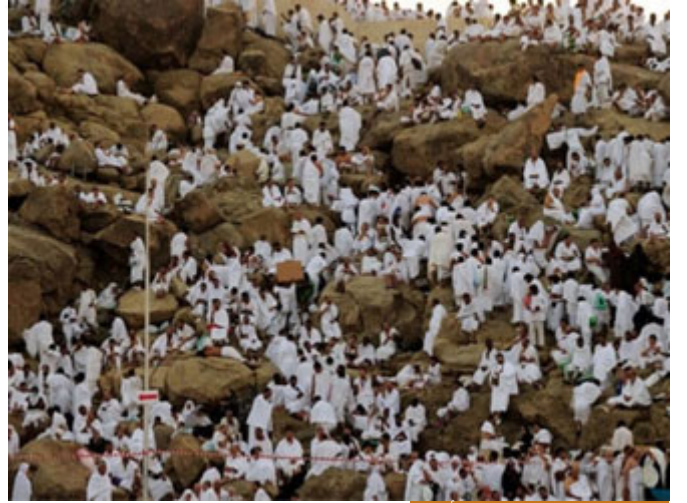
الوقوف بعرفة هو الركن الأعظم

فما ارتضاه لنا ربنا نرتضيه كما ارتضاه دون زيادة ولا نقصان، إنه يوم من أيام الله لأنه يوم عيد، يقول صلى الله عليه وسلم: