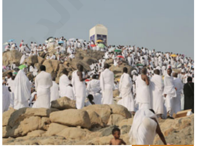
يوم عرفة يومٌ من أيام الله

أيها الأخوة الكرام؛ إن يوم عرفة يومٌ من أيام الله لكثرة ما يعتق الله فيه عبيداً من نار جهنم، روى الإمام مسلم في صحيحه عن عائشة رضي الله عنها، أن رسول الله صلى الله عليه وسلم قال: