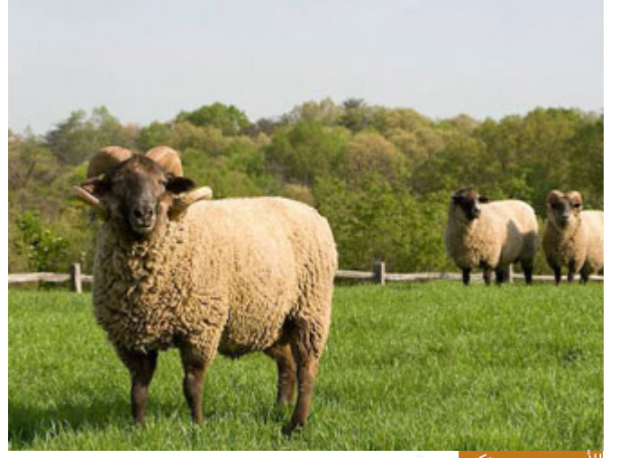
الأضحية سنة مؤكدة

قال كثيرٌ من الصحابة والمفسرين: صلِّ لربك صلاة العيد وانحر الأضحية، وفي الصحيح: