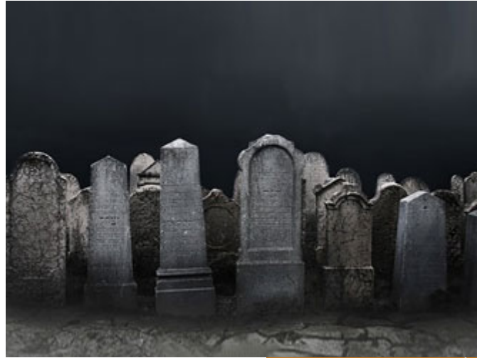
الأحاديث كثيرة في إثبات عذاب القبر

﴿وَلَوْ تَرَىٰ إِذِ الظَّالِمُونَ فِي غَمَرَاتِ الْمَوْتِ﴾ في الشدائد، غمرات الموت: شدائد الموت، يعني كنت رأيت شيئاً عجبياً جداً، لن أقوله لك، لكن الموقف جداً صعب، هذه الآية نص في عذاب القبر، ووجه على من ينكر عذاب القبر، طبعاً الأحاديث كثيرة في إثبات عذاب القبر، لكن هذه الآية نص قرآني، هي وقوله تعالى: