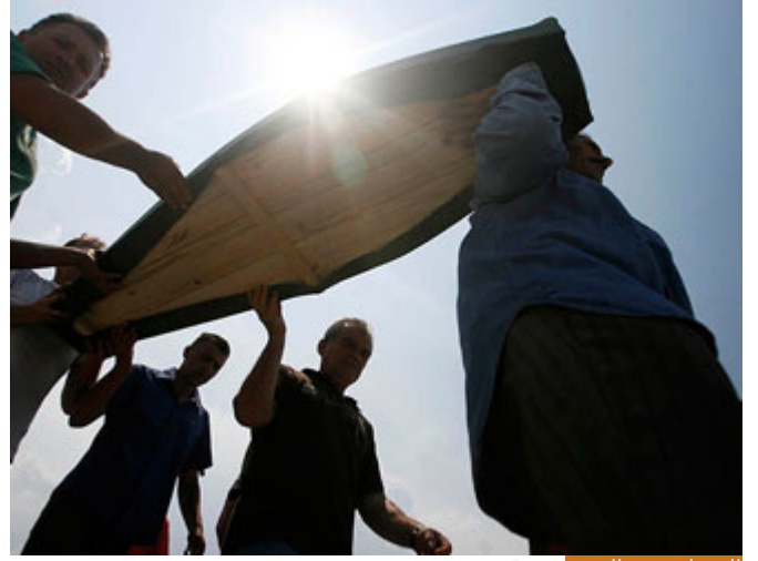
الحساب عند الموت

﴿وَمَنْ قَالَ سَأَزِلُّ مِثْلَ مَا أَنْزَلَ اللَّهُ﴾ أيضاً أشخاص، هنا جل جلاله يتكلم عن حوادث وقعت في مكة لن نفوس في تفصيلاتها، لكن هناك من ادعى النبوة، هناك من قال آتي بآيات تشبه آيات القرآن الكريم، فهنا يفضحهم جل جلاله، ﴿وَمَنْ قَالَ سَأَزِلُّ مِثْلَ مَا أَنْزَلَ اللَّهُ﴾ أين الحساب؟ الحساب عند الموت.