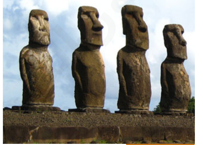
الصنم يجعل على شكل شيء

لما ماتوا قال أقوامهم نصب لهم أصناماً "تمثيل" حتى نذكرهم، فلما تُبِيح العلم عُيِدت من دون الله، فهي أصلها لرجال صالحين.