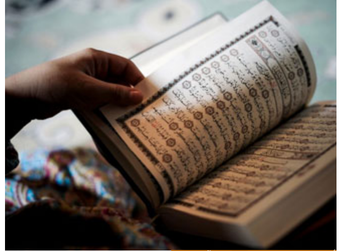
أسلوب مجارة الخصم في القرآن الكريم

الشيء الأول: سيدنا إبراهيم عنده أسلوب يسمى مجارة الخصم، وهو معروف عند المناطق، مجارة الخصم، يعني إذا كنت تجلس في حوار أو جدال مع شخص، لا أقول حواراً، جدالاً، فاشتد الجدال بينك وبينه أو الججاج، يعني كل يدلي بحجته ليبطل حجة الآخر، واحتدم الجدال، فالآن من الأساليب التي يستخدمها بعض الناس هي مجارة الخصم في بعض كلامه من أجل إبطاله بعد ذلك، فيقول له بالعامية سأمنشي معك، كما تقول تمام، فيسّر؛ أنه وافقني على فكرة، لكن هو يهين له ما يبطل الفكرة بعد أن جاره عليها؛ ليكون وقعها أشد، يكون وقع الإبطال أشد بعد أن جاره عليها، وهذا أسلوب موجود حتى في القرآن،