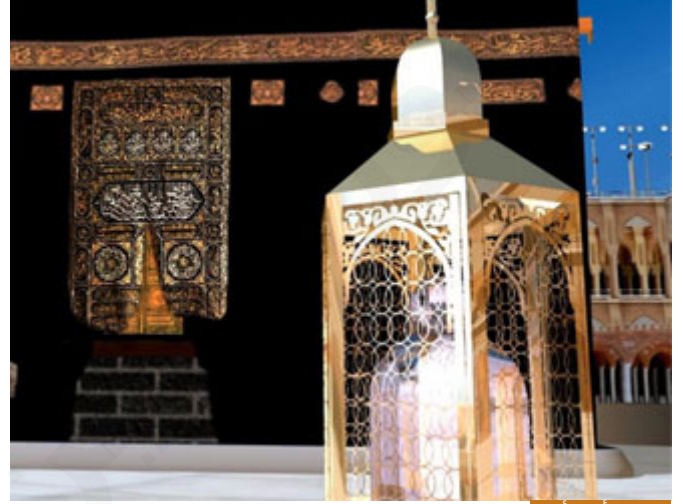
إبراهيم أبو الأنبياء

بِسْمِ اللَّهِ الرَّحْمَنِ الرَّحِيمِ وَإِذْ قَالَ رَبُّكَ لِلْمَلَائِكَةِ إِنِّي جَاعِلٌ فِي الْأَرْضِ خَلِيفَةً ۖ قَالُوا أَتَجْعَلُ فِيهَا مَن يُفْسِدُ فِيهَا وَيَسْفِكُ الدِّمَاءَ وَنَحْنُ نُسَبِّحُ بِحَمْدِكَ وَنُقَدِّسُ لَكَ ۖ قَالَ إِنِّي أَعْلَمُ مَا لَا تَعْلَمُونَ (30)