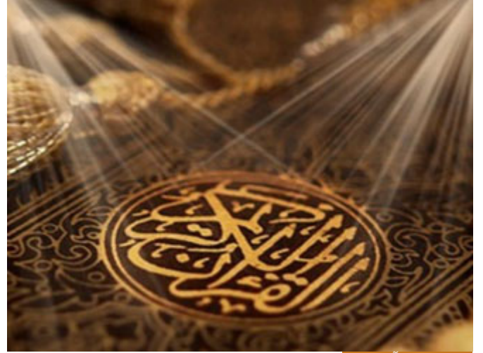
نحن نتبع القرآن الكريم

يتضح أن كل الآيات تتحدث عن والد سيدنا إبراهيم، ولو كان عمه لقال لعمه وانتهى الأمر، لكنه قال لأبيه، فهو والده، طبعاً الذين أرادوا أن يجعلوه عمه أشكل عليهم أن يكون والد نبي مشركاً أو كافراً، ولكن هذا لا يمنع، استدلووا بحديث أن النبي صلى الله عليه وسلم قال: "إنما ولدت من أصلاب الأطهار وفي رحم الطاهرات" وهذا الحديث لا يصح، ولو افترضنا صحته فالنبي طاهر ابن طاهر، من الطهارة بمعنى أنه من النكاح لا من السفاح، لكن ليست الطهارة التي تناقض الشرك الذي هو نجس معنوي، لكن ليس نجساً حقيقياً، فالمقصود بطهر نسله صلى الله عليه وسلم أنه كله من زواج، ومن نكاح صحيح، وليس من سفاح والعياء ذ بالله.