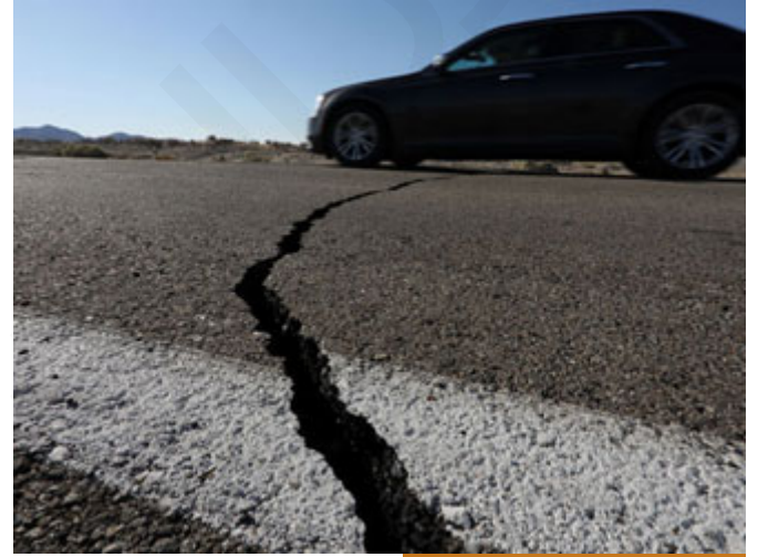
اختلاف المظاهر الكونية هو نذير عظيم

الكون أيها الأحياء يسير وفق نظام، نحن كل يوم نصحو ونعلم أن الشمس ستشرق من مشرقها، وعند الغروب ستغرب من مغربها، ندرك ذلك، وألفنا النعمة، تمشي الأرض بنا وألفنا النعمة، تنتفس الهواء وألفنا النعمة، عندنا مرض اسمه "إلف النعمة" ألفتنا نعم الله تعالى علينا، فما عدنا ننتبه لأهميتها، يوم القيامة عندما تُزلزل الأرض، وتنفطر السماء، وتنشق السماء، وتكور الشمس، وتسجر البحار، اختلاف المظاهر الكونية هو نذير عظيم من نذر الله تعالى، في هذا المعنى يقول صلى الله عليه وسلم يوم كسفت الشمس على عهده، نحن في الساعة الثانية عشر ظهراً الشمس ساطعة في رابعة النهار، لكن لو الساعة الثانية عشر ظهراً والشمس كأنه وقت الغروب، إذاً هناك شيء يستدعي النظر.