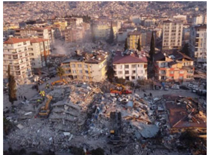
الزلازل المدّرة الذي ضرب تركيا وسورية

وبعد: فما زال الحدث الأبرز في الأيام الأخيرة هو ذلك الزلزال المدّرة الذي ضرب أجزاء من تركيا وسورية، وهذا الحدث على ما فيه من مأس شديدة إلا أنّ فيه أيضاً من رحمة الله تعالى ولطفه الشيء الكثير، وعند حدوث أي ظاهرة كونية تكتر أسئلة الناس حول هذه الظاهرة، ويكثر الأخذ والرد، ويكثر القيل والقال، ولا بد دائماً للخطاب الديني أن يتناول هذه الظواهر الكونية من وجهة نظر شرعية؛ لأنها الوجهة الوحيدة التي تأتي متكاملة غير منقوصة، فلا بد أن نصي على هذه الأحداث الأخيرة من منظور إيماني، وقيل كل شيء، ولأن كثيراً من الإخوة يتابعوننا عبر وسائل التواصل فلا بد أن نعزي كل من فقد قريباً، أو حبيباً، أو أخاً، أو صديقاً، أو أي أحد من المسلمين في هذه الكارثة.