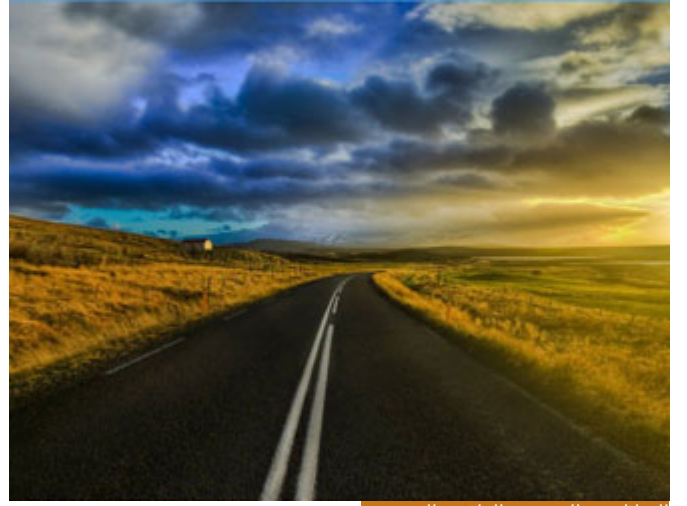
الضلال هو البعد عن الطريق المستقيم

المبين: هو الشيء الواضح، وقد يكون الضلال مبيناً عندما يكون الحق واضحاً، ويضل الإنسان عنه، متى يكون الضلال مبيناً؟ عندما يكون الحق واضحاً، هناك ضلالٌ بعيد، وهناك ضلالٌ مبين، الضلال المبين؛ كان تكون مسافراً إلى بلدةٍ من البلاد، وقبل كيلومتر بدأت الإشارات والشاخصات ترشدك إلى أنه للوصول إلى البلدة التي تريدها يجب أن تذهب على اليمين بعد ألف متر، ثم بعد تسعمئة متر، ثم بعد ثمانئة، إلى أن قالوا لك: بعد مئة، ووضعوا لك شاخصاً مبيناً، اذهب إلى اليمين، ثم لم تلتفت وقيت مستمراً في طريقك، فهذا ضلالٌ مبين، الحق واضح، أما الضلال البعيد؛ فهو أن تستمر في هذا الطريق الخطأ حتى تقطع به عشرات الكيلومترات، ثم تعرف أنك قد ضللت الطريق، فهذا ضلالٌ بعيد، فهناك ضلالٌ بعيد، وضلالٌ مبين، هنا قالوا: (إِنَّا لَنَرَاهَا فِي ضَلَالٍ مُّبِينٍ)، السؤال هنا، امرأة العزيز (في ضلالٍ مبين) تراود فتاها، هي تتبع شهوتها وهي امرأة متزوجة فهي تعصي الله، وتخون زوجها، وتخون قصرها، يعني هي ضلالها مبينٌ في كل الأعراف، سواءً بالعرف الديني أو يعرف القصور.