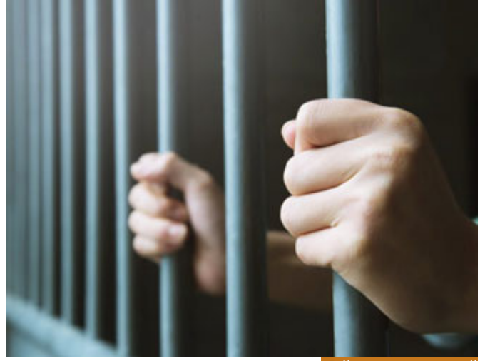
السجن هو حجز حرية الفرد

(لَيْسَجْتَنَّ وَتَكُونَنَّ مِنَ الصَّاعِرِينَ): السجن هو حبس حرية الفرد ومنعه من الإتيان بالآخرين، أو بممارسة حريته في مكان ما وحيداً أو مع مجموعة من الناس، والسجن الانفرادي أشد والعياذ بالله من السجن الذي فيه أناس لأن الوحدة أمرٌ خطيرٌ جداً، فهذا هو السجن، وقد يكون معه ذلٌ، ومهانةٌ، وضربٌ، وتقرعٌ، فيكون (مِن الصَّاعِرِينَ) يحاولون تصغيره في السجن.