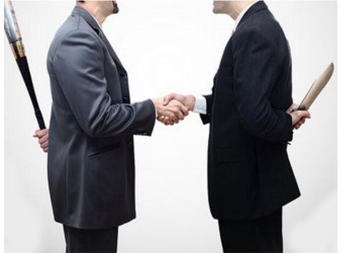
المكر في الأصل هو ستر شيء خلف شيء

(قَلَمًا سَمِعَتْ يَمَكُرُهَا) هذا كان مكرًا، ليس انتصاراً للفصيصة، وليس حباً بالخير، وليس رغبةً بإصلاح سوء نفس امرأة العزيز، أبداً، ولكن هي العيرة التي تنتاب النساء، لا سيما في تلك المجتمعات فأردن فضيحتها، وبيان ضلالها، وأنها تراود فتاها الذي يخدم في قصرها عن نفسه، وهي امرأة لها تلك المكانة، أردن أن ينزلن من مكانتها في المجتمع، ولعلها في السهرات التي كانت تجربها معهن تظهر بمظهر الناصح، وبمظهر المرأة الجيدة، والمرأة التي تعيش في القصر مع زوجها بأبهى وأحسن حال، وتباهي بحبها لزوجها، وبحب زوجها لها كما تفعل النساء، الآن أردن أن ينتقم منهن، ولكن لم يكن ذلك انتصاراً للفصيصة، فضجهن المولى جل جلاله قال: (قَلَمًا سَمِعَتْ يَمَكُرُهَا) هذا مكرٌ وليس انتصاراً للفصيصة، والمكر في الأصل هو ستر شيء خلف شيء، يعني أنت تُظهر شيئاً، وتريد شيئاً آخر، فتستر ما تريد بما لا تريد، فهن يسترن رغبتهن بفضيحتها بقولهن: (إِنَّا لَنَرَاهَا فِي ضَلَالٍ مُّبِينٍ) لم يقولوا: نريد أن نفضحها، قالوا: نريد أن نصلحها، ونصلح ضلالها، وهن في الحقيقة يمكن به.