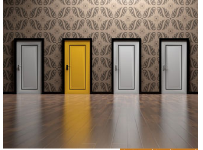
الصبر في القصر كان صبر اختيار

في الجب، ثم في القصر، ثم في السجن، امتحاناتُ ثلاث، قلت لكم؛ إنني أعتقد أن أصعب الامتحانات هو امتحان القصر، لأن صبر يوسف فيه لم يكن صبر اضطرار، وإنما كان صبر اختيار، في السجن لا بديل، في الجب لا بديل، أما في القصر كان بإمكانه أن ينجو في الظاهر، بأن يستجيب لأمرها وانتهى الأمر، ويعز في القصر أكثر وأكثر، ويكرم أكثر وأكثر، وتنتهي الأمور، وليس لأحد مصلحة في نشر الفضيحة، لكنه صبر في القصر صبر اختيار، بينما صبر في السجن وفي الجب من قبله صبر اضطرار، وكلها قاسية على النفس، لكن أشدها فيما أعتقد امتحان القصر.