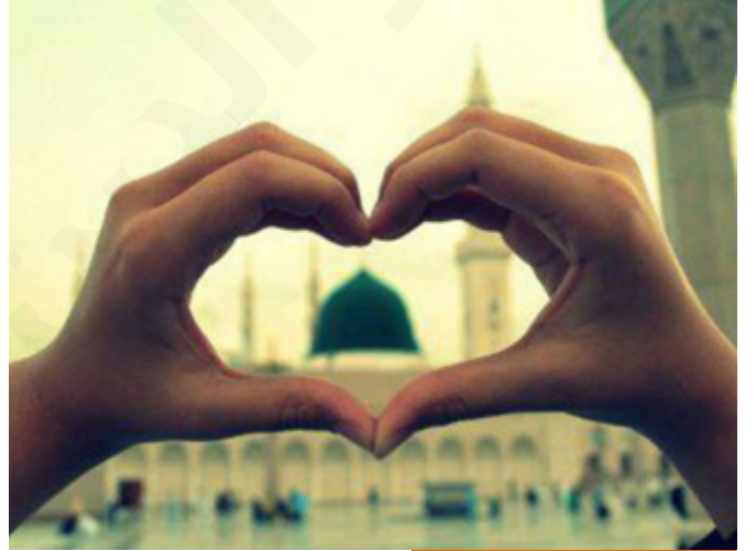
عقوبة السجن في عصر النبي الكريم

سيدنا محمد صلى الله عليه وسلم سجن ثلاثة أشخاص، لكن بعكس السجن المعروف، سجن ليس له نظير في تاريخ البشرية، الأصل أنك تسجن إنساناً فتضعه وحده في السجن، سيدنا محمد صلى الله عليه وسلم الثلاثة الَّذِينَ خُلْفُوا كَعَبُ بْنُ مَالِكٍ، وَهَلَالُ بْنُ أُمَيَّةِ الْوَاقِفِيِّ، وَمُرَارَةُ بْنُ الرَّبِيعِ الْعَمْرِيِّ، هؤلاء الثلاثة الَّذِينَ خُلْفُوا واعترفوا بذنبهم وأرجئ أمرهم، خُلْفُوا: أي أُرْجئ أمرهم إلى الله، وهم تخلفوا عن غزوة تبوك من غير عذر، فالنبي صلى الله عليه وسلم سجنهم، فأمر الناس بعدم الحديث معهم، ولا البيع، ولا التجارة، ولا الشراء منهم، ثم أمر نساءهم باعتزالهم، خمسون ليلة وهم في السجن، سجن انفرادي من الطراز الأول، دون أن يضعهم في السجن، هذا سجن بعكس السجن المعروف، لم يحبس حريتهم، ينطلقون أين ما شاؤوا، لكن لا أحد يكلمهم حتى تاب الله عليهم: