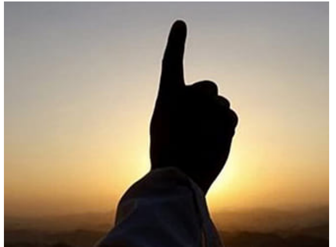
سلطة التحليل والتحريم بيد الله تعالى وحده

ما تحدثنا عنه من هذه الصور غير الشرعية لتقسيم الأنعام هو محاولة البشر أن يجعلوا لأنفسهم سلطة في التحليل أو التحريم، في الإباحة أو المنع، وكأنهم هم من يملكون هذه السلطة، والحقيقة أن هذه السلطة لله تعالى وحده.