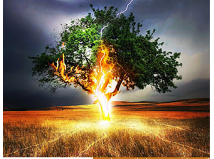
التحريم التأديبي عقاب على الذين هادوا بغيرهم

حتى يكمل ربنا عز وجل صورة التحليل والتحريم قال سأعطيك الآن صورة من صور التحريم، وهي التحريم التأديبي، التحريم الذي هو في الأصل حلال، لكن حُرِّمَ تأديباً لقوم، فأنت تقول لابنك: ممنوع كذا وكذا، وأن تذهب لهذا المكان لأنه حرام، ولهذا المكان ولهذا المكان، ولكن في يوم من الأيام فعل شيئاً فلم تعطه مصروفاً فسالك المصروف حرام؟ أجبته: لا، ليس حراماً ولكنه اليوم مُحَرَّمٌ عليك تأديباً لك، وهذه قاعدة في أنه المُحَلَّلُ قد يُحَرَّمُ ليس على صيغة أن تقول أن الله حرمه، لا، لكن نمنع منه تأديباً لمن؟ مثل إنسان أسرف في الطعام، فقلت لأولادك هذا الأسبوع لا يوجد لحم نهائياً لأنكم لا تحترمون النعمة، وسألوك اللحم حرام يا أبي؟ قال: لا ليس حراماً ولكن أنتم تحتاجون هذه العقوبة، فيوجد تحريم تأديبي، هذه التحريم التأديبي جعله الله تعالى على الذين هادوا بغيرهم، بين بغيرهم في آيات أخرى، فقال: