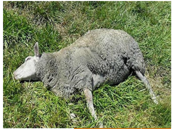
الميتة لا يجوز أكلها حتى ولو تمت التسمية عليها

فنقول لهم: والله لو كانت ذبيحة فهي حلال، سموا عليه واكلوه ، وهذا ما يفعله اليوم كثيراً من اليهود، فهم حتى اليوم يذبحون ولا يأكلون الميتة أبداً، إذا كنت في طائرة ومسافر من بلد إلى بلد، وتريد أن تأكل لخباً، ولا يوجد ذبح إسلامي، فاللحم المذبوح حقيقة هو الذي وُضع عليه ختم الحاخام اليهودي؛ لأنهم يذبحون بغض النظر عن انحرافاتهم الأخرى، لكن هم في الذبح يذبحون الأنعام.