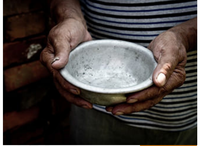
الفقر هو فقير الضرورة

حتى بموضوع الفقر نحن نخلط بين الضروريات والحاجيات والتحسينيات، نقول فلان فقير، خير؟ ألم تر الهاتف الذي يحملة؟ ذو المائة دينار، ليس لديه هاتف ذكي، لا زال على الهاتف القديم الذي يحتوي على أزرار، هو فقير تحسينيات، هو فقير على شيء تحسيني، لا على شيء حاجي. الفقر هو فقر الضرورة، ويمكن ببعض الحاجيات أن تنزل منزل الضروريات اليوم، فتدخل إلى بيت لا تجد فيه براد فتقول: فقير هذا مقبول، ولكن إذا لم يكن هناك شاشة فهو فقير! لا، لا يوجد براد هذه حاجة وليست ضرورة، ولكنها بلغت اليوم في حياتنا المعاصرة والوضع العام جعل البراد ليس من الحاجيات، وإنما من أعلى الحاجيات التي قد تنزل منزلة الضروريات، مثل المسكن صار، لأنه لا تستقيم الحياة أن يحضر كل يوم طعام لهذا اليوم فقط، كل الحاجيات تحفظ في البراد اليوم، ولم تعد طرق الحفظ القديمة موجودة... إلخ