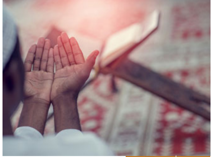
غاية التمكين أن نعيد الناس لربهم

فإذا تم ذلك كله، فما الغاية من التمكين؟ هل الغاية من التمكين أن نقيم الحفلات الغنائية؟ هل الغاية من التمكين أن نجعل الإعلام الفاسد يدخل بيوتنا ويمكثون في الأرض؟ لا (تَعْبُدُونِي لَا يُشْرِكُونَ بِي شَيْئًا)، غاية التمكين أن نعيد الناس لربهم، أن نقيم شرع الله، فإذا مُكِّنَا في الأرض دون أن نحقق الشروط فسيكون هذا التمكين كتمكين الغرب الآن في الأرض، هل تتخيلون أيها الإخوة أننا لو مُكِّنَا في هذه الأرض ونحن على هذه الحال سنقيم شرع الله؟! لا والله، وأرجو ألا أحلف، بل سنقيم ما يقيمته الغرب في بلادهم؛ لأننا في الأصل نتطلع إليهم، فنصاعف من فسادهم عندما يُمكن في الأرض، نحن على خوفنا وذلنا وضعفنا لا نقيم شرع الله -عزَّ وجلَّ- فإذا مُكِّنَا سنكون (تَعْبُدُونِي لَا يُشْرِكُونَ بِي شَيْئًا)؟! سنكون (الَّذِينَ إِنْ مَكَّنَّهُمْ فِي الْأَرْضِ أَقَامُوا الصَّلَاةَ وَآتَوُا الزَّكَاةَ وَأَمَرُوا بِالْمَعْرُوفِ وَنَهَوْا عَنِ الْمُنْكَرِ)؟! أم سيكون (نهوا عن المعروف وأمروا بالمنكر) هنا المشكلة، لذلك قلت لكم؛ الاستخلاف والتمكين وعد من الله، ثقوا به؛ انتهى، القرار صيد لا تراجع فيه، إله الذي يعد (وَعَدَ اللَّهُ) أنشك في وعد الله؟! لكن نشك في أننا نأتي بالشرط أو لا، والله ما أتينا بالشرط؛ طاعة مطلق، إيمان، عمل صالح عندها (وَعَدَ اللَّهُ الَّذِينَ آمَنُوا مِنْكُمْ وَعَمِلُوا الصَّالِحَاتِ لَيَسْتَخْلِفَنَّهُمْ فِي الْأَرْضِ كَمَا اسْتَخْلَفَ الَّذِينَ مِنْ قَبْلِهِمْ وَلَيُمَكِّنَنَّ لَهُمْ دِينَهُمُ الَّذِي رِزَقُوا لَهُمْ وَلَيُبَدِّلَنَّهُمْ مَن بَعَدَ خَوْفِهِمْ أُمَّمًا يُعْبُدُونِي لَا يُشْرِكُونَ بِي شَيْئًا وَمَنْ كَفَرَ بَعْدَ ذَلِكَ فَأُولَئِكَ هُمُ الْفَاسِقُونَ)