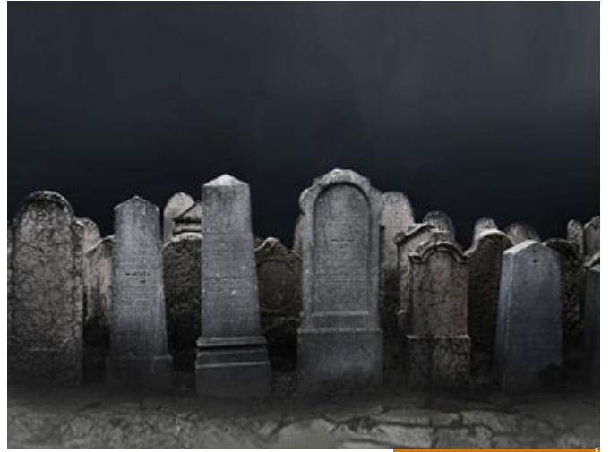
أصعب العذاب انتظار العذاب

بارك الله بكم، كما تفضلتم هذه الآية في الأنفال، وهي آية تثبت ما ينفيه اليوم بعض الذين يتكلمون على وسائل التواصل، وهو موضوع عذاب القبر الذي كان النبي صلى الله عليه وسلم يستعذب منه دائماً قبل ختام الصلاة، فيقول أعود بك من أربع، ومنها عذاب القبر، فهذه الآية تثبت هذا العذاب؛ لأنها تتحدث عن البرزخ، وَلَوْ تَرَىٰ إِذْ يَتَوَفَّى الَّذِينَ كَفَرُوا ۖ الْمَلَائِكَةُ يَضْرِبُونَ وُجُوهَهُمْ وَأَدْبَارَهُمْ وَذُوقُوا عَذَابَ الْخَرْبِ أنا أشبه عذاب القبر برجل محكوم بالإعدام قد وُضع في زنزانة مفردة، وهو مهيباً للإعدام، وهناك أوقات يُفْتَح فيها الباب ويُقَدَّم له بعض الطعام، لكن كلما فُتِح الباب في وقت غير مخصص للفتح وللطعام يقول: قد جاؤوا لأخذي إلى الإعدام، فيعيش حالة الرعب الدائم المستمر إلى أن تحين ساعة القصاص العادل، المحكمة التي أقرت حكم الإعدام، وهذا الذي بنى مجده على أنقاض الناس، وطغى وبغى، وكفر بالله، وأساء إلى عباد الله تعالى، في حياة برزخه يُعَذَّب، فمنذ أن يغادر الدنيا إلى أن يلقى الله تعالى هو في حالة عذاب مستمر؛ لأنه ينتظر العذاب، وأصعب العذاب انتظار العذاب، وأجمل السعادة انتظار الفرح والسعادة، فيعيش تلك الحياة وَلَوْ تَرَىٰ إِذْ يَتَوَفَّى لرأيت عجايب الجواب محذوف، لرأيت عجايب منهم وهم يَضْرِبُونَ وُجُوهَهُمْ وَأَدْبَارَهُمْ لأن الموت عندهم مصيبة، بينما الموت عند المؤمن تحفة المؤمن، وعرس المؤمن، غداً تلقى الأعبة محمد وصحبه، فالموت عند المؤمن بداية الخير، وبداية السعادة، من لحظة وفاته تبدأ حياة البرزخ سعيدة هنيئة لأنه سيلقى ربه.