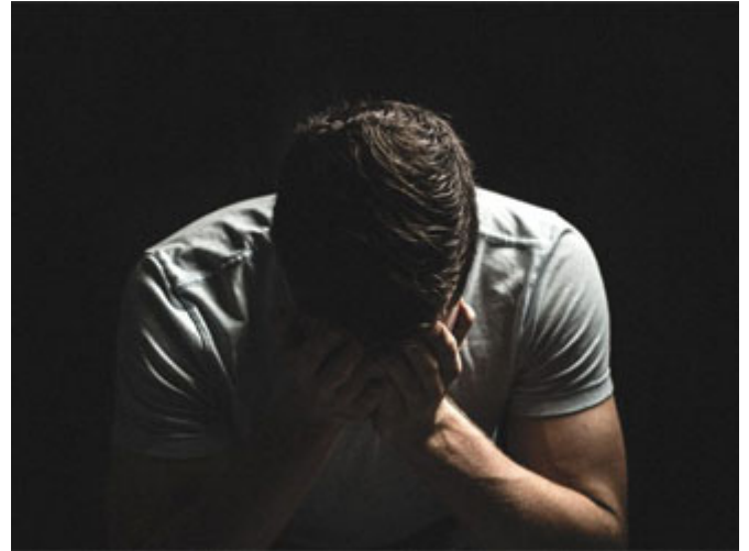
أعظم الخيانة أن يخون الإنسان ربه

وفي الآية الأخيرة التي تفصلت بها ملمح جميل جداً: وَإِنْ تُرِيدُوا حَيَاتِكُمْ فَقَدْ خَانُوا اللَّهَ مِنْ قَبْلُ فَأَمْكَنَ مِنْهُمْ لأنه من درج على الخيانات الكبرى فلن يبالي بالصغيرة، فلا غرابة بعدئذٍ ممن يخون البشر إذا كان قد خان رب البشر، فأعظم الخيانة أن يخون الإنسان ربه، أن يخون الإنسان الله تعالى، فهذه أعظم خيانة فمن ترك ما أمّنه الله عليه من الصلاة، والزكاة، والعبادات، والطاعات، والقربات، وعض البصر، وحفظ اللسان، من ترك هذه الأمانة فهو أقدر على ترك هذه الأمانات الصغيرة وقد خان رب البشر، ولاحظي أن الآية الكريمة تقول: وَإِنْ تُرِيدُوا حَيَاتِكُمْ فَقَدْ خَانُوا اللَّهَ مِنْ قَبْلُ فَأَمْكَنَ مِنْهُمْ هناك آيات: