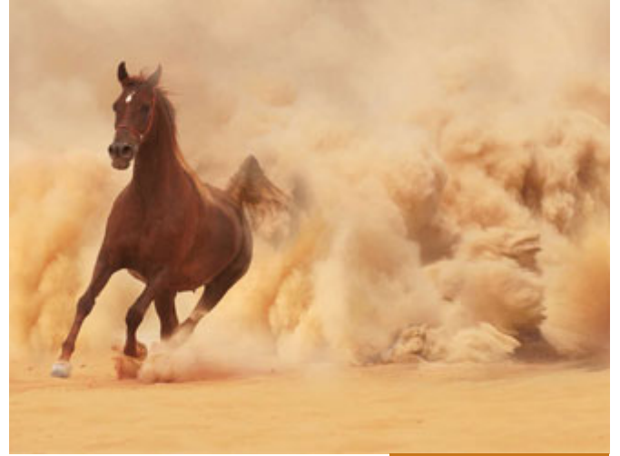
عندما تركض الخيول تثير النقع

بِسْمِ اللَّهِ الرَّحْمَنِ الرَّحِيمِ فَوَسَطْنَ بِهِ جَمْعًا (5)