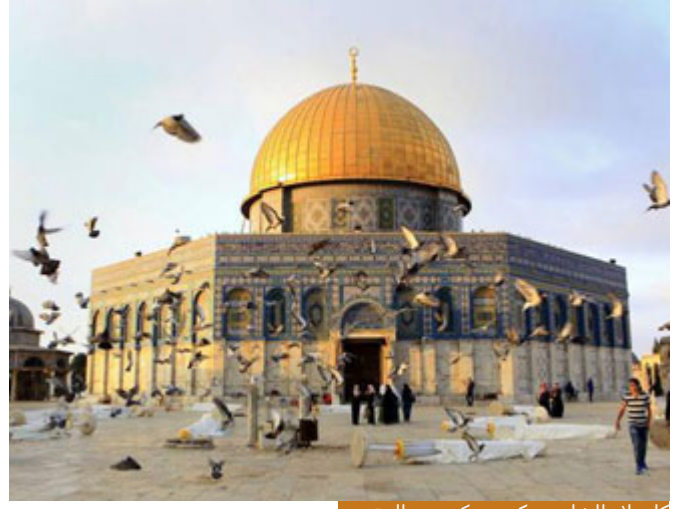
كل بلاد الشام يوركت ببركة بيت المقدس