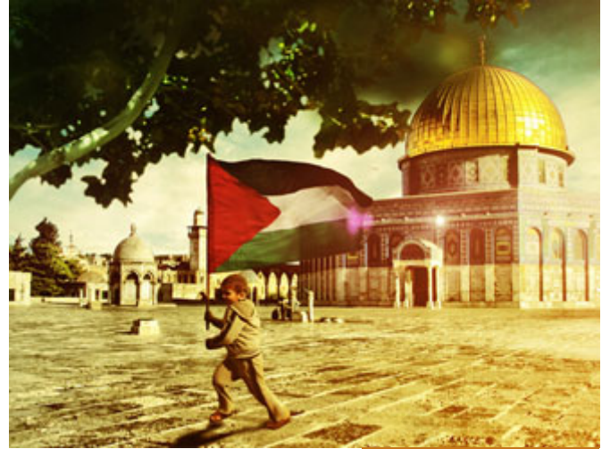
التين والزيتون موطنهما فلسطين

القَسَمُ الأول بالتين؛ والتين هو الشجرة المعروفة التي تؤكل، والزيتون الشجرة المعروفة التي تُعصر؛ تؤكل وتعصر، وهذا تفسير ابن عباس -رضي الله عنهما- ومجاهد وغيره لما سئل: ما التين، والزيتون؟ قال: التين تينكم الذي تأكلون، و الزيتون زيتونكم الذي تعصرون، ربنا -عزَّ وجلَّ- يلفت نظرنا للتين والزيتون، لكن لا يمنع أن يقال: إن التين والزيتون موطنهما هو بلاد الشام وفلسطين على وجه التحديد وما حولها مما بارك الله تعالى فيه من الأرض، فهاتان الثمرتان لهما موطن، فلا يمنع- لاسيما أن بعد ذلك إشارة إلى الطور في سيناء وإشارة إلى البلد الأمين مكة المكرمة-، لا يمنع أن يقال: إن في القسم بالتين والزيتون إشارة إلى مكان التين والزيتون المعروف جغرافياً وهو بلاد الشام المباركة و فلسطين وبيت المقدس التي بارك الله بها وبارك حولها، أي لا يمنع هذا من ذلك، هو قسم بالتين والزيتون وإشارة إلى موطن التين و الزيتون، والزيتون شجرة مباركة وصفها القرآن الكريم بأنها شجرة مباركة، والنبى- صلى الله عليه وسلم- كما في المستدرک على الصحيحين بسند صحيح، قال: