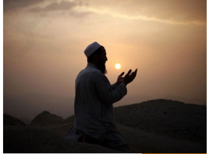
حُسن الصلّة بالله عز وجل

النبي صلى الله عليه وسلم يعلمنا بذلك أن أول ما تفعله لبناء أي مجتمع صغير أو كبير، أول شيء حُسن الصلّة بالله عز وجل، المسجد يمثل حُسن الصلّة بالله تعالى، طبعاً المسجد في صدر الإسلام لم يكن للصلاة فقط، كان يجتمع فيه المسلمون للتشاور، وتُعقد فيه الألوية، تُعلن فيه الحرب، يعلن فيه السلم، يجتمع فيه الناس، مكان مقدس لكن قدسيته لا تمنع كما يظن البعض اليوم أن قدسية المسجد تمنع أن يكون فيه شيء غير الصلاة، لا، المسجد مكان مادام ضمن المنهج فممكّن أن يكون فيه أشياء كثيرة ومهمة جداً بعد قيمة الصلاة العظيمة، لكن الهدف الرئيسي من المسجد هو حسن الصلّة بالله تعالى، فأول ما ينبغي لبناء المجتمع أن تكون صلته بالله تعالى قوية.