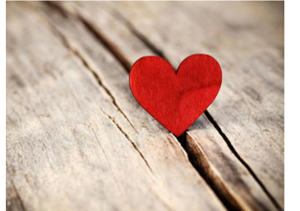
الخير ينبغي أن يُقابل بخير

من أعظم الأحاديث في قواعد الشرع العامة وقواعد الحياة العامة: