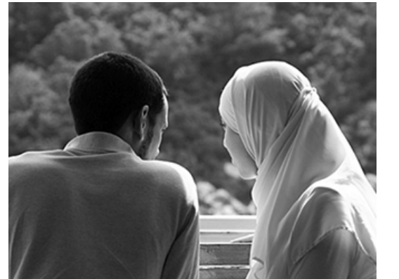
الرجل في البيت هو ريان السفينة

فإذا نشزت المرأة بمعنى أنها ترفعت عن طاعة زوجها؛ خرجت عن السيطرة، أي "أنا ليس لك علي طاعة، أنا مثلي منك" واليوم هناك النسويات دائماً كأنهم لم يسمعوا بهذه الآيات، المرأة مطلوب منها أن تكون ضمن مؤسسة فيها قائد، وينبغي أن تكون مطيعة له في معروف، فيما تعارف عليه الناس، وهو ينبغي ألا يأمر إلا بمرء معروف، مثل تماماً الطائفة، الطائفة لها ريان هو قائد الطائفة ولها مساعد، المساعد تحت درجة لكن يطلب منه القيام بالمهمة عند وجود أي مشكلة عند القائد، فالرجل في البيت هو ريان السفينة أو الطائفة، وللمرأة قال: