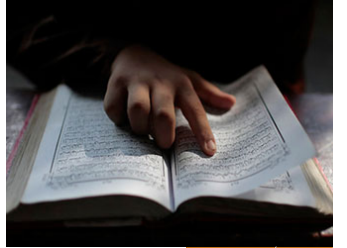
الإنسان في الأصل مجبور على السترة

لأن الإنسان في الأصل مجبور على السترة، والتعري هو منهج الشيطان، فالشيطان هو الذي أراد أن يبدي لهما عوراتهما و سواتهما، لكن لما أراد الله -عز وجل- أن يسكنهما الجنة حجب عنهما رؤية السوءات والعورات، فلما ذاقا من الشجرة انتقالاً من طهر السماء إلى وحل الأرض فظهرت العورات، والعورات المعنوية أكثر من المادية، الإنسان يسوءه أن يرى الناس عورته وهذا خلق إسلامي عظيم -العورة المادية-، لكن أيضاً يسوءه أن يرى الناس عورته المعنوية في بيته، له أسلوب في التعامل في بيته فلا يحب أحدًا أن يتجسس عليه، زوجته، بناته هؤلاء من عورة الإنسان مما يسوءه أن ينظر الناس إليهم، وقع في معصية مغلوياً على أمره، لا يحب أن ينظر الناس إليه، فتتبع عورته حتى ينظر إليه، اليوم يوجد وسائل جديدة لتتبع العورات عبر وسائل التواصل، عبر كسر كلمة السر فبدل إلى حسابه وينظر إلى الصور التي وضعها، أو يأخذ جواله وقد خرج فينظر في الصور التي عنده؛ صور أهله أحياناً، أحياناً صورته هو لكن صورته بجلسات، بشيء لا يحب أن يظهره للناس جعله في هاتفه الخاص، فهذا أيضاً من تتبع العورة، فالجزء من جنس العمل، فإذا إنسان جعل ديدنه أن يتتبع عورات الناس فإن الله تعالى يتتبع عورته ويفضحها، الله تعالى في الأصل ستير-جل- جلاله- من أسمائه الستير فهو يستتر، لكن إذا إنسان انتهج نهج تتبع العورات فإن الله -عز وجل- لا يستتره بل يفضح هذا الجزء من جنس العمل، وقال صلى الله عليه وسلم: