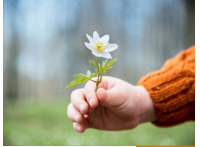
مجازة المحسن بإحسانه

وهي أيضاً توجيه للناس أن يجازوا المحسن بإحسانه، الأب في بيته يجب أن يجازي الابن المحسن بإحسانه حتى يشجع الآخرين على الإحسان، والمدير في شركته إذا موظف متفان في العمل يأتي قبل بداية الدوام ويخرج بعد نهايته من أجل أن ينهي كل ما بيده من أعمال، يجب أن ينظر مدير الشركة إلى هذا الأمر بعين الإحسان ويحسب له حتى يكافئه، وحتى يشجع الآخرين على أن ينهجون نهجه، والمعلم في صفه، والزوج مع زوجته، والزوجة مع زوجها إلى أعلى المستويات؛ قاعدة عامة (هَلْ جَزَاءُ الْإِحْسَانِ إِلَّا الْإِحْسَانُ)، وهذا الاستفهام استفهام تقريرى، الاستفهام في اللغة العربية إما أن يكون حقيقياً كأن أسأل إنساناً: هل جئت أمس إلى الجلسة؟ هذا استفهام حقيقى فيقول: نعم أو لا؛ أحتاج جواباً، هناك استفهام إنكاري كان أقول لطالب من الطلاب قد تعبت عليه كثيراً ثم جاء بعلامات متدنية، فأقول له: ما هذه النتيجة؟ لا أريد منه جواباً فالنتيجة أمامي وأنا أعرفها، لكن أريد أن أستنكر عليه هذه النتيجة بعد هذا الجهد مني، وهناك استفهام تقريرى كان أريد أن أقرر حقيقة فأتي بها على طريقة الاستفهام لأن الاستفهام إنشاء، والإنشاء يثبت في النفس أكثر من الحقيقة المباشرة فبدلاً من أن يقول الله تعالى: يجب أن يكون جزاء الإحسان إحساناً، قال: (هَلْ جَزَاءُ الْإِحْسَانِ إِلَّا الْإِحْسَانُ)، أي لا ينبغي أن يكون جزاء الإحسان إلا إحساناً، فمن يحسن ينبغي أن يحسن إليه، فهذا توجيه رباني لكل الناس أن يجازوا بالإحسان إحساناً، وهو -جل جلاله- وهو الغني عن عبادته ألزم نفسه -إن صح التعبير- والله لا يلزمه شيء ولا يسأل عما يفعل لكن إلزاماً ذاتياً، فأراد أن يلزم نفسه بالإحسان إلى من أحسن -جل جلاله- (هَلْ جَزَاءُ الْإِحْسَانِ إِلَّا الْإِحْسَانُ)، وفي المقابل: