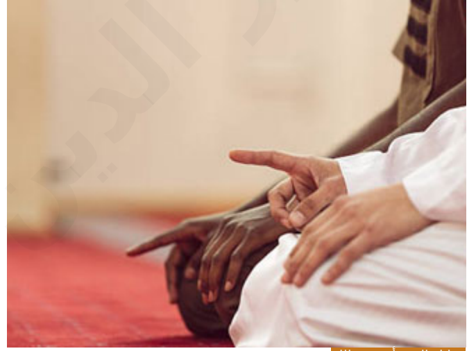
مقابل الجنة أن تعبد الله

شخص اشترى منك سلعة، وقبل أن يفعل بها شيئاً أو يبيعها أو شيء، قال لك والله أنا ندمت، ليس لدي طريقة لتصرف هذه البضاعة، طننت نفسي قادراً ولم أستطع، العدل أن تقول له: أنا بعت والعقد لازم، وأنقض المجلس، والإحسان أن تقول له: هات البضاعة، وهذا ثمنها، والله معك، تُقيل عثرته تُقيل الله عثرتك يوم القيامة، فقال: "ربح البيع، لا نقيط ولا نستقبل"، لا نفيخ العقد، ولا نطلب فسخه، عقد لازم لأن الجنة في مقابل أن تعبد الله، ولا نشرك به شيئاً، وندافع عن رسول الله صلى الله عليه وسلم، يعني الثمن بسيط في مقابل السلعة التي يبيعها الله.