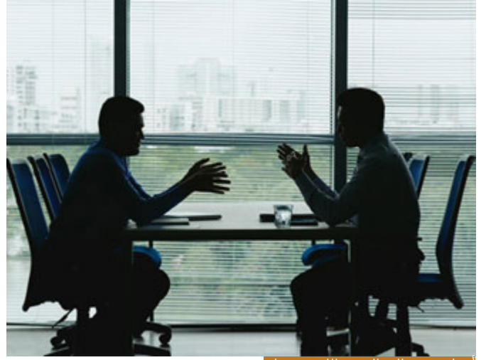
أخطر شيء الجدل في الله بغير علم

هلي عندما التقط آل فرعون موسى التقطوه من أجل أن يعاديهم لا، لكن هكذا كانت النتيجة، هذه يسمونها لام العاقبة، ليست لام التعليل، وهنا قد يكون هدفه (لِيُضِلَّ عَنْ سَبِيلِ اللَّهِ) وقد لا يملك هذا التصور، ولكن في الحقيقة فعله يصل الناس عن سبيل الله، لأن هناك أناساً عندهم ضعف بالإيمان فتأخذهم أي شبهة، يقول لك: والله على الفيس بوك تكلم فلان، عندما تبين له يقول لك: صحيح مباشرة، ولكن كم من إنسان أضل هذا الذي خرج على الإعلام و(بُجَادِلُ فِي اللَّهِ يَغَيِّرُ عِلْمَ وَلَا هُدَىٰ وَلَا كِتَابٌ مُّبِينٌ) وإنما بهوي نفسه وجعل يلوي النصوص كما يلوي عنقه ليضل عن سبيل الله، ويتأولها تأويلات باطلة بعيدة عن اللغة وفهم السلف الصالح، من أجل أن يحرف الناس عن منهج الله تعالى ويحل لهم الحرام، وهذا أخطر شيء الجدل في الله بغير علم، انظر قد يعصي الإنسان ربه، وكلنا عصاة ونسال الله السلامة، لكننا لا نستحل المعاصي، أنا أقول لك: والله هذا الأمر حرام، لكنني فعلته وأرجو الله أن يغفر لي، لا يوجد مشكلة، وإستغفر الله وكلنا ذو خطأ، ولكن أسوأ شيء أن أفعل الحرام وأريد أن أبرره وأن أشرعته للناس، وأنا أقول لهم هذا هو الحق، هنا المصيبة، هذا من (بُجَادِلُ فِي اللَّهِ يَغَيِّرُ عِلْمَ) الحكم الشرعي حرام وأنا اضطررت وفعلته فأسأل الله أن يعفو عني، أما الحكم الشرعي حلال لأنني أريد أن أفعله وقد غلطيت نفسي، هنا المصيبة.