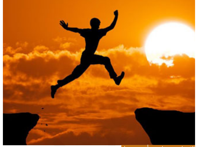
الإنسان من طبيعته أنه يستعجل

فتناسب المبدأ مع الختام، في المبدأ (وَيَوْمَئِذٍ نَفَعُ الْمُؤْمِنُونَ * يُنْصِرُ اللَّهُ يُنْصِرُ مَنِ نَشَاءُ) وكأن المؤمن يسأل: متى نصر الله؟ وقد أثبت الله تعالى في قرآنه أن بعض المؤمنين سألوا متى نصر الله؟ الإنسان من طبيعته أنه يستعجل، أي إذا قلت له: بعد شهر تستلم مبلغاً من المال، باليوم الخامس والعشرين يبدأ يسأل، كم بقي؟ يومان، ثلاثة، خلق الإنسان عجولاً.