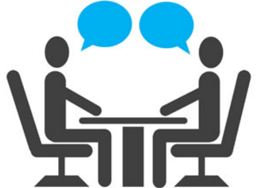
الإنشاء لا يحتمل التصديق والتكذيب

أحبنا الكرام؛ هذه السورة افتتحت (وَيَوْمَئِذٍ نَفَعُ الْمُؤْمِنُونَ * يُنْصِرُ اللَّهُ يُنْصِرُ مَنِ نَشَاءُ) كأن سائلاً يسأل: متى نصر الله؟ جاء ختام السورة (قَاصِرٌ إِنَّ وَعْدَ اللَّهِ حَقٌّ وَلَا تَسْتَخِفُّكَ الْأَرْضُ لَا يُؤْفُونَ).