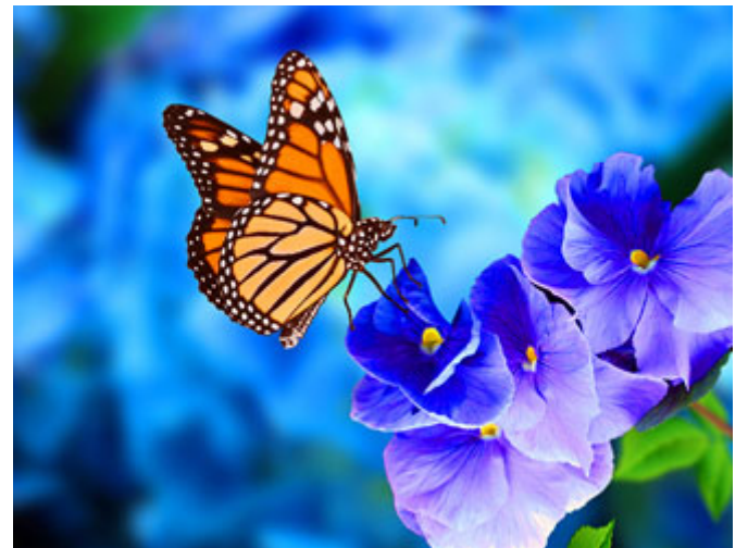
كمال الخلق يدل على كمال التصرف

إذا كان هناك مهندس بشركة كبيرة، أوفدته الشركة إلى شركة مايكرو سوفت من أجل شراء متني حاسب من الطراز الأول الصناعي من أجل الشركة، فهذا أول شيء يبدأ إميلات و مراسلات قبل السفر، عندما يصل إلى هناك يحجز فندقاً، وينزل، ويأخذ عروض أسعار ثم يحجز، يعمل العقد، ويوقع، ويدفع عربوناً ينتقل لبلده تأتي البضاعة، مايكرو سوفت بهذا البناء الضخم، وبالشركة الكبيرة تتصرف هكذا.