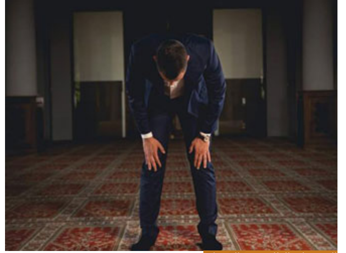
الصبر على الطاعة بعد الشهوات

واصطبر مبالغة من واصبر ( وَاصْطَبِرْ عَلَيْهَا ) كيف الصبر على الطاعة؟ أنتم الآن صابرون جميعاً على كلامي، هذا صبر على الطاعة، هو للأمانة وأنا معكم لو كانت الجلسة جلسة لهو، مسامرة، أجمل من درس علم، أي أسهل على النفس، موضوع أجمل، أحياناً الإنسان يتذوق الجمال بأذواق عالية، يقول لك: والله أحلى جلسة علم مع الأخوة، لكن أنا أتكلم عن الأسهل على النفس، ما الأسهل؟ أن تجلس في مجلس علم، أو أن تجلس للمسامرة مع أصدقائك، والمزح، والنكات، فالآن هذا مجلس صبر، إنك تصبر على شيء، عندما تقف بين يدي الله وتقول: الله أكبر، تحتاج إلى الصبر، لأن النفس تنازعك مثلاً لعدم القيام من الفراش لصلاة الفجر، تنازعك لتأخير الصلاة والاستعاضة عنها بمتابعة شيء على الشاشة، فأنت تحتاج إلى المصابرة على الطاعة، تجبس النفس عن الشهوات، والمعاصي، وتلزمها بالطاعة إلزاماً، هذا الصبر على الطاعة.