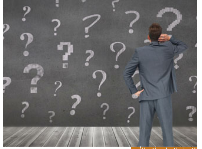
الإنسان لا يعلم عاقبة الأمور

ما معنى الجواب الرابع؟ هذا جواب مهم جداً، أحياناً الإنسان يطلب شيئاً لا يعلم عاقبته، يريد المال وهو لا يعلم أن هذا المال يُطغيه، يريد المنصب وهو لا يعلم أن هذا المنصب الذي ربما يصل إليه فيتجبر على عباد الله فيستحق النار، فالإنسان لا يعلم عاقبة هذه الأمور، فقال: تطلّبين ما لا تعلمين عاقبته وربما كان فيه ضررك، فمثلك كمثل طفلٍ محمومٍ وهو يطلب الحلوى، طفلٌ صغيرٌ مريض، والطبيب قال لهم: إياكم أن تعطوا هذا الطفل الحلوى لأنه يُضُرُّ بصحته، والطفل يبكي يريد الحلوى وأبوه يمنع الحلوى عنه، هل نقول: إن هذا الأب ظالمٌ قاسٍ يمنع ابنه مما يريد، أم نقول: إن هذا الأب رحيمٌ ودودٌ يشفق على ابنه من أن يأكل الحلوى فيزداد مرضه أو يتأخر شفاؤه؟ لا شك أنها الثانية، كلنا ذاك الإنسان، كلكم نسأل الله أن يحفظ لكم أبناءكم، عندكم أولاد، الولد مرضٌ ويُريد شيئاً أنت تمنعه منه، لماذا تمنعه منه؟ هل تمنعه فسوةً عليه أم رحمةً به؟ هنا السؤال؟ فربنا جلّ جلاله يمنع عنا أحياناً أشياءً لأنه يحينا ولأن عاقبتها ليست خيراً لنا، نحن لا نعلم الغيب وليس لنا علمُ كعلم الله، علم الله شاملٌ، واسعٌ، عامٌ، ونحن ليس لنا علمُ كعلمه (وَاللَّهُ يَعْلَمُ وَأَنْتُمْ لَا تَعْلَمُونَ) فنطلب أشياءً فيها ضررنا فيمنعها الله عنا رحمةً بنا، هذا معنى الجواب الرابع، قال تعالى: