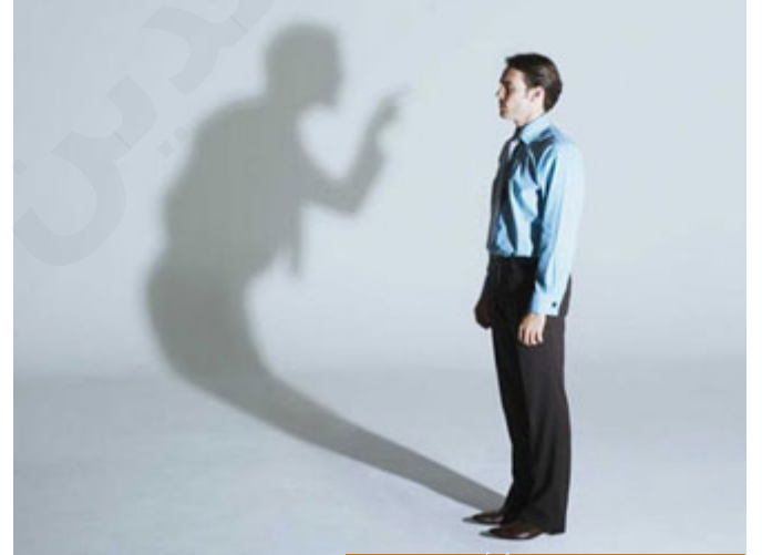
الإنسان المؤمن العاقل يبدأ بأن يُقاضي نفسه

قال: فلما تدبرت ما فُلتته سكنت بعض السكون، يعني نفسه اطمأنت قليلاً لكن ليس كما ينبغي، قال: فقلت لها: ( وعندي جوابٌ ثانٍ، وهو أنك - أيتها النفس - تقتضين الحق بأغراضك ولا تقتضين نفسك بالواجب له وهذا عين الجهل ) كيف ذلك؟ يعني أنت تطالبين من الله تعالى أغراضك، الإنسان له أغراضٌ في الدنيا، مال، جاه، شفاء، قوة، يسر، فهو يطلب من الله وهذا مشروع وينبغي للإنسان أن يدعو الله، ولكن قال لها: أنت تطالبين الحق بأغراضك، يعني أنت تطالبين الله بأشياء لك تريدينها، ولا تقتضين نفسك بالواجب له، الإنسان المؤمن العاقل يبدأ بأن يُقاضي نفسه بما يجب أن يُقدِّمه لمولاه قبل أن يطلب من مولاه، أنت مطلوبٌ منك أن تعبدته حق عبادته: