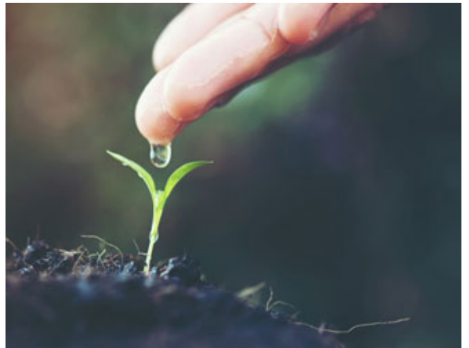
كل إنسان فيه خير

فأعزّ الله الإسلام بعمر، الشاهد أن النبي صلى الله عليه وسلم كان يطلب القدوات واليُحِبُّ، فعمر إذا أسلم أسلم معه خلق كثير، وعمر إذا أسلم أعزّ الله الإسلام به لقوته ولبأسه ولمكاته في القبيلة فكان صلى الله عليه وسلم يعلم ذلك، لكن في الوقت نفسه النبي صلى الله عليه وسلم يدعو بإسلام عمر يقتدي به الناس في الإسلام ويُعزّ الله به الإسلام، لكنه لا يتنازل صلى الله عليه وسلم عن شيء من الدين لرجل من الرجال كائناً من كان، فهذه هي المعادلة، فالنبي صلى الله عليه وسلم كان يدعو: (اللَّهُمَّ آعِزِّ الْإِسْلَامَ بِأَحَبِّ هَذَيْنِ الرَّجُلَيْنِ إِلَيْكَ، يَا بِيَّ جَهْلٍ أَوْ يُعَمَّرُ بِنِ الْخَطَّابِ، قَالَ: وَكَانَ أَحَبَّهُمَا إِلَيْهِ عُمَرُ) رضي الله عنه، فأسلم عمر بعد هذه الحادثة بقليل، حادثة أم عبد الله بنت حنمة التي روتها، في السنة السادسة للبعثة، كانت نقطة البداية كما يقول كتاب السيرة لبين القلب من الكلمات التي انطلقت من هذه المرأة، نظر إليها عمر، امرأة تهاجر وترك أرضها لا لشيء إلا لأن قومها يسومونها سوء العذاب وهي لم تفعل شيئاً إنما تلتزم دينها وتلتزم أمر ربها، فعمر رضي الله عنه في هذه اللحظة بدأ شعاع الإيمان يدخل إلى القلب.