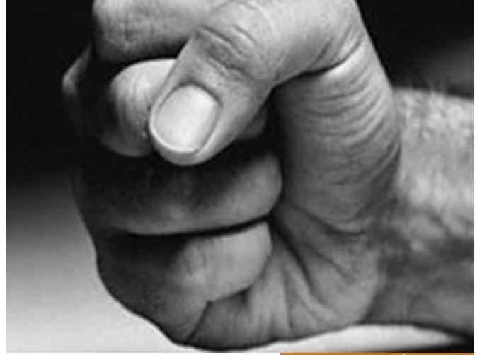
سيدنا عمر عُرف بالشدة والقسوة

بداية الحديث من قصة تروبها أم عبد الله بنت حنمة، كانت من المهاجرات إلى الحبشة، فتقول: لما كنا نرتحل مهاجرين إلى الحبشة أقبل عمر، كان مشركاً، حتى وقف عليّ، وكنا نلقى منه البلاء والأذى والغلظة علينا، فقال لي: إنه الانطلاق يا أم عبد الله؟ نويتم الرحيل، قلت: نعم، والله لنخرجنّ في أرض الله، أذيتونا وقهرتمونا حتى يجعل الله لنا فرجاً، فقال عمر: صجّكم الله، قالت: ورأيت منه رقّة لم أرها قط. الناس يعرفون عن عمر الحزم، الشدة والقسوة، لكن عمر رضي الله عنه لما وليّ الخلافة قال: والله إن هذا الأمر لا يناسبه إلا ما ترى، والله لو يعلم الناس ما في قلبي لأخذوا عني عباة هذه، من شدة تواضعه ولبنه للمسلمين، فهو كان لينا في موضع اللين وشديداً في موضع الشدة. فلما جاء عامر بن ربيعة وذكر له ذلك قال: كأنك طمعت في إسلام عمر؟! مستنكراً عليها، قلت: نعم، فقال: إنه لا يسلم حتى يسلم حمار الخطاب! فكان يائساً من إسلام عمر، لشدة عمر ومعرفته به وبأنه لا يلين جانبه. إلا أن رسول الله صلى الله عليه وسلم بما آتاه الله عز وجل من وحي السماء وبما آتاه الله عز وجل من حنكة القيادة والخبرة بالرجال؛ كان يقول: