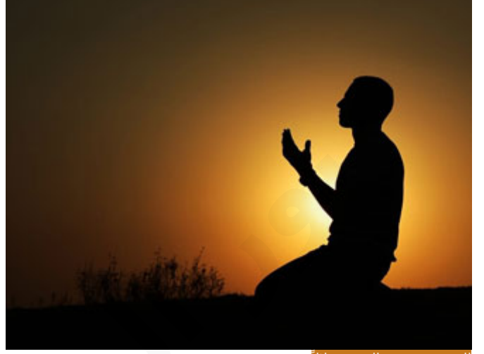
الرهبية تجمع مع الخوف جلالاً

(وَأَيُّ قَارِهُونَ) شدة الخوف، والرهبية تجمع مع الخوف جلالاً، الرهبية ليست خوفاً فقط، أنت ممكن أن تقول: خفت من ثعبان، أو خفت من سيارة مسرعة، لكن أن تقول: رهبت، مثال: أنا أرهب معلمي، معلمك لا يخوف ولكن هناك جلال يعطي في القلب خوفاً مع إجلال، هذا اسمه رهبية، فهنا موسى عليه السلام يقف في هذا الوادي بجلال الله، وبعظمة الله، ويتجلي الله عليه، هذه الطواهر الغربية التي لم يألّفها أنتجت الرهبية، فقال له: (وَاصْمُمُ إِلَيْكَ جَنَاحَكَ مِنَ الرَّهْبِ) لماذا سمي اليد جناحاً؟ تشبيهاً بجناح الطائر، فكان الطائر عندما يرفرف بجناحيه، هذه الرقرفة توحى بالرهبية والخوف لأنه ارتجاف، والصم يوحى بالاطمئنان، والأم إذا صمت ابنها إليها اطمأن، فداًئماً الصم يوحى بالاطمئنان، والرجفان والخفقان يوحى بخفقان القلب، فعبر القرآن بهذا التعبير اللغوي الرائع، شبه يده بالجناح حتى ينقل لك صورة حالته وهو في هذا الموقف، هذا ما يسمى التصوير الفني في القرآن الكريم، أي الكلمات تُعبر عن المدلول وكأنك تراه، أنت تقرأ مثلاً: