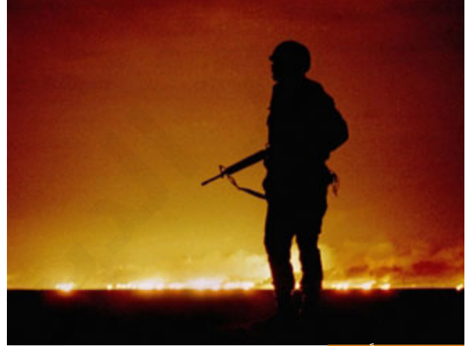
الكفر ليس مبرراً للحرب

فإذا قلنا: إن فلاناً كافر، هل نحن نصفه؟ مبدئياً نحن كبشر ليس كإله هل نصفه أم نذمه؟ مبدئياً وصف، فلان من الناس لا يؤمن بما يؤمن به، عينه في غطاء عما كشفه الله لي، بمعنى عما اتضح لي من القرآن والسنة، عينه في غطاء، فهو كافر بما يؤمن به، هذه الكلمة لا تدعو ولا تعني أنني أريد أن أحاربه، لأن الكفر ليس مبرراً للحرب، هل إذا إنسان كافر أي لا يؤمن بما يؤمن به؟ هل يجب أن أحاربه؟ هل يوجد بالشرع شيء كهذا؟ لا، لا يوجد شيء كهذا في الشرع.